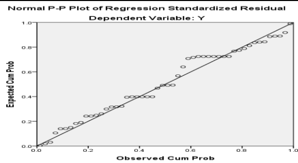
Gambar 3. Uji Normalitas