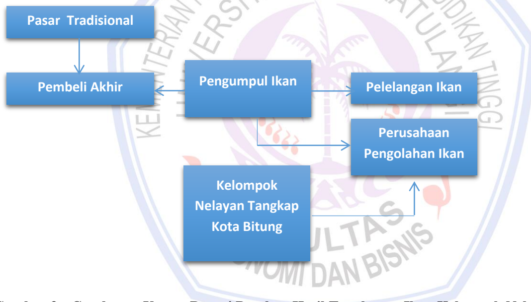
Gambar 3. Gambaran Umum Rantai Pasokan Hasil Tangkapan Ikan Kelompok Nelayan Tangkap Kota Bitung