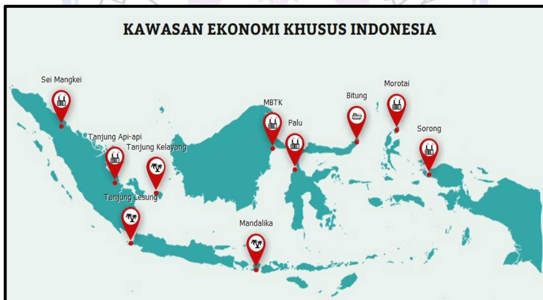
Gambar 1. Wilayah yang menjadi zona – zona Kawasan Ekonomi Khusus di Indonesia