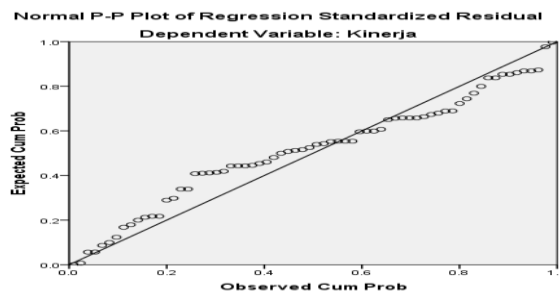
Gambar 2. Hasil Uji Normalitas