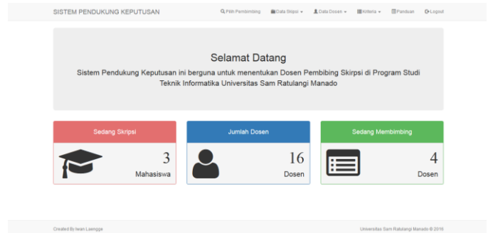
Gambar 2 Halaman Utama

Halaman utama menampilkan informasi tentang jumlah mahasiswa, jumlah dosen, dan jumlah dosen yang sedang membimbing.