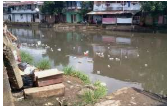
Gambar 3. Kondisi Fisik Kuala Jengki