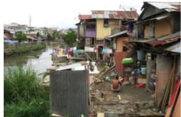
Gambar 4. Kondisi Sempadan Sungai