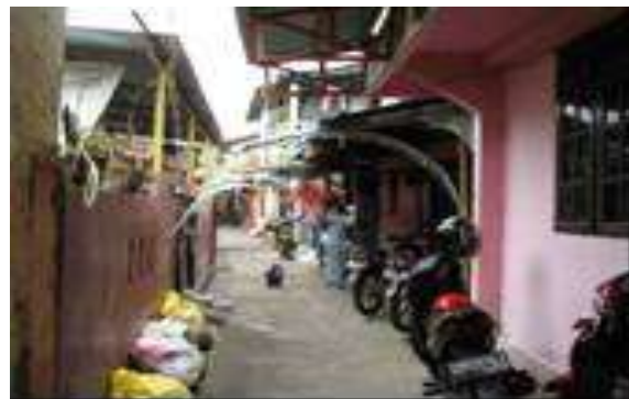
Gambar 7. Sistem Sirkulasi Yang Tidak Memadai