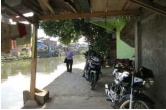
Gambar 5. Alih Fungsi Area Sempadan Sungai