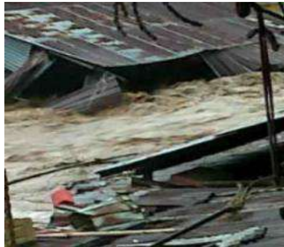
Gambar 6. Kondisi Bangunan Yang Hanyut Oleh Banjir Januari 2014