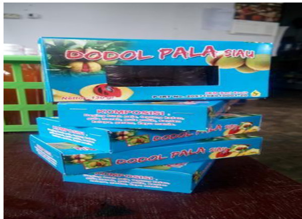
Gambar 2. Dodol Salak yang telah dikemas

Harga Produk Dodol Salak yang telah dikemas Rp. 15.000 per kemasan seperti pada Gambar 2.Dengan ukuran 130 gram setiap kemasan.