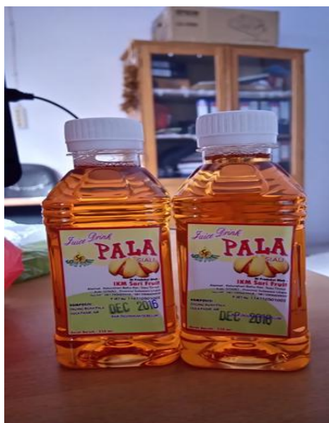
Gambar 4. Produk Sirup Pala

Bahan untuk membuat Sirup Pala adalah rebusan buah pala yang dibuang pada pembuatan selai pala. Cara membuat adalah pertama air rebusan dimasak dengan gula pasir dengan perbandingan 1 liter air dengan 1 kg gula. Masak hingga mendidih dan mengental. Bisa ditambahkan pewarna makanan/minuman untuk tampilan, namun lebih disarankan tidak menggunakan zat pewarna tersebut, biarkan warna alaminya. Setelah mendidih dan mengental, didinginkan dan siap dikemas dalam botol. Gambar produk Sirup Pala disajikan Pada Gambar 4.