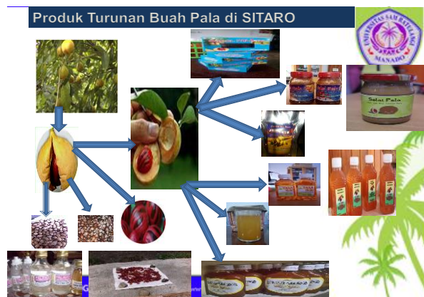
Gambar 1. Produk Turunan Daging Pala di Kab. Kepl. SITARO

Berdasarkan hasil penelitian terhadap 45 pengolah produk pangan berbahan baku Pala, teridentifikasi produk olahan yang diproduksi di Kabupaten Kepulauan Siau Tagulandang Biaro yang berbahan baku Daging Pala adalah Dodol Pala, Selai Pala, Permen Pala, Manisan Pala, Sirup Pala, Juice Pala dan Anggur Pala, seperti disajikan pada Gambar 1.