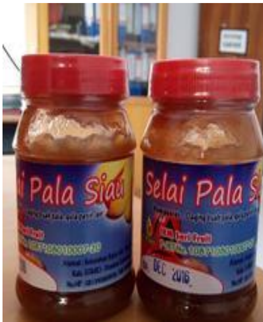
Gambar 3. Produk Selai Pala

mendidih, kemudian dinginkan. Setelah itu air rebusan disisihkan. Air rebusan ini dapat disimpan dan digunakan sebagai campuran dengan gula pada waktu merebus daging pala yang sudah dihaluskan. Merebus Pala dilakukan secara berulang-ulang hingga 3 kali, untuk menghilangkan rasa asam pala. Setelah itu Pala diblender dagingnya sampai halus. Setelah itu, dimasak dengan air, dan dicampur dengan gula. Untuk mendapatkan bau yang harum, diberi bubuk kayu manis. Untuk membuat produk menjadi lebih awet, produk selai dapat dipanaskan atau dihangatkan, dan taburi lagi gula pasir hingga warna menjadi warna lebih tua, hitam atau merah. Ini merupakan cara mengawetkan tanpa bahan pengawet kimia yang dapat menjadikan selai pala tahan selama berbulan-bulan. Gambar Selai Pala disajikan pada Gambar 3.