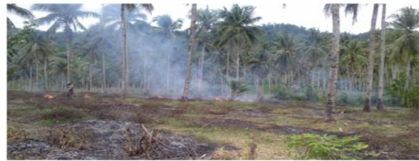
Gambar 2. Cara petani membuka lahan kebun dan ladang

penggunaan lahan untuk memenuhi kebutuhan hidupnya. Proses membuka lahan Seperti yang tersaji pada gambar 2: