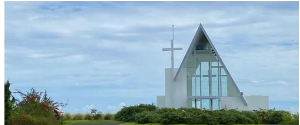
Gambar 1. Chapel Stella Maris

menambah daya tariknya. Selain itu, pemandangan Gunung Lokon dan udara segar menciptakan suasana yang menenangkan bagi para pengunjung.