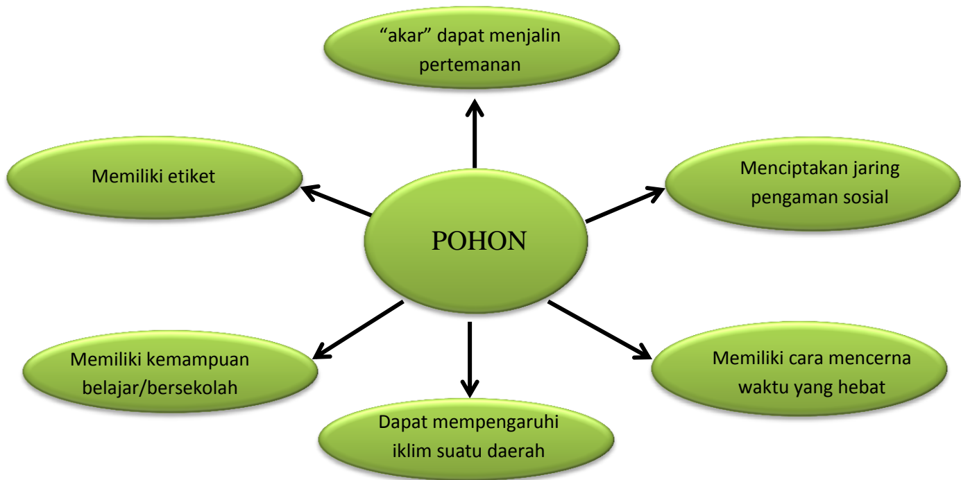
Gambar 1. Kepemimpinan bertumbuh

Definisi kepemimpinan bertumbuh mengacu pada filosofi pohon. Perhatikanlah bagan berikut: