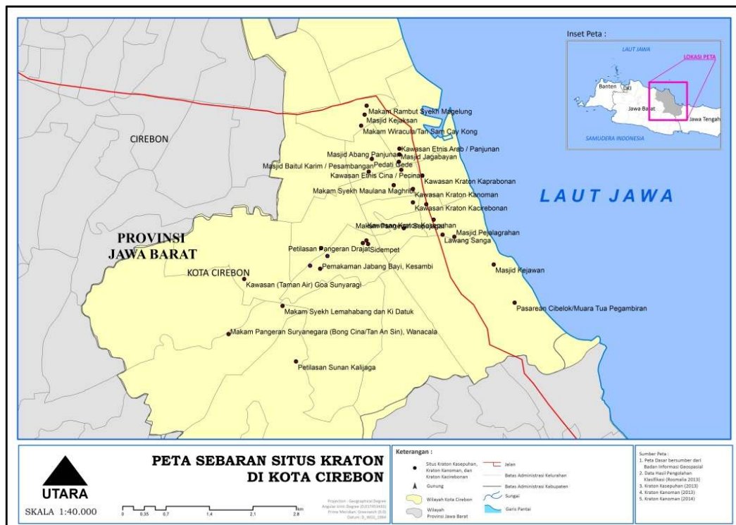
Gambar 3 Posisi Kramat-kramat Kraton di Kota Cirebon.

Hingga saat ini, kramat-kramat kraton yang berada di Kota Cirebon ini masih berfungsi sebagai tempat ritual tradisi, baik untuk ritual budaya, maupun untuk ritual ibadah. Penyelenggaraan ritual-ritual tradisi