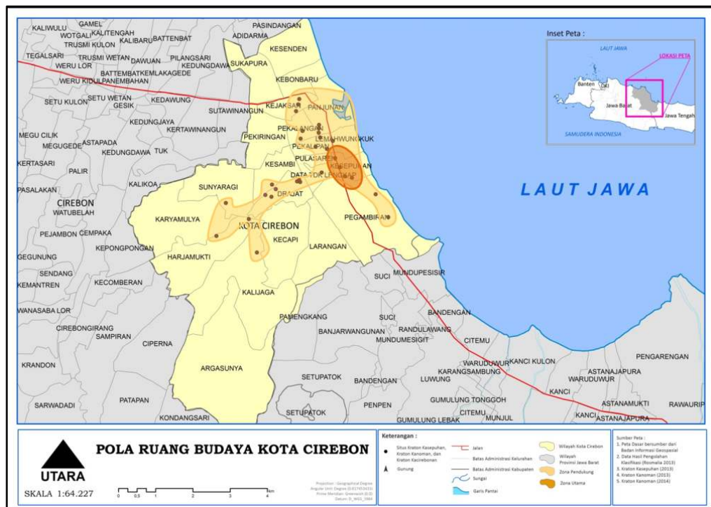
Gambar 5 Ruang Budaya Kota Cirebon

Zona ini disebut juga sebagai ruang pusat kebudayaan. Selanjutnya, zona pendukung merupakan kawasan tempat kramat-kramat kraton berada. Kramat-kramat ini berfungsi sebagai pendukung kebudayaan. Posisi zona pendukung mengelilingi zona utama, yang berfungsi sebagai penyanggah kebudayaan. Beberapa kegiatan kebudayaan diselenggarakan pada zona utama terkadang melebar hingga ke kawasan yang merupakan zona pendukung. Gambaran posisi kedua zona tersebut dapat dilihat pada Gambar 5.