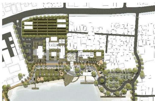
Gambar 2. Rencana Tapak Kawasan Situ Jatijajar

Model penelitian ini memaparkan hasil akhir berupa eksplorasi rancangan inovasi untuk Kawasan Wisata Air yang dapat dilihat pada Gambar no.3 Perspektif Tampak Mata Burung sebagai berikut.