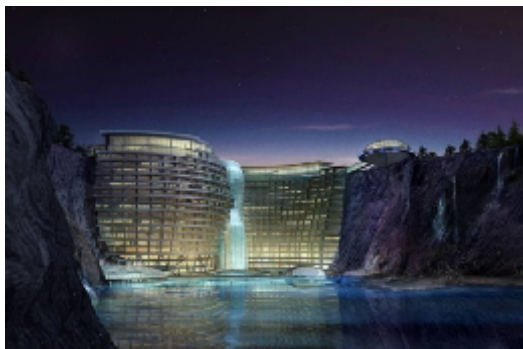
Gambar 2.3 (hotel songjiang)

Pada bagian bangunan, otomatisasi pada bagian pintu dan pada jendela. Dan memberikan otomatisasi pada bagian lain untuk pengaturan kenyamanan suhu udara, dll.