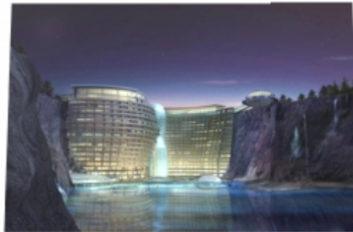
Gambar 2.5.2 (Atas Air)

Nuansa alami yang sangat baik untuk orang-orang yang hidup di perkantoran. Pada bagian ruang konferensi sebaiknya diberikan otomatisasi yang lebih yang dapat berubah-ubah menyesuaikan dengan pengguna,misalnya untuk orang tua nuansa dalam ruangan akan berubah sesuai dengan nuansa orang tua, demikian juga buat orang muda nuansa ruangan berubah menyesuaikan, sehingga bisa menyesuaikan dengankebutuhan psikologi pengguna, dll.