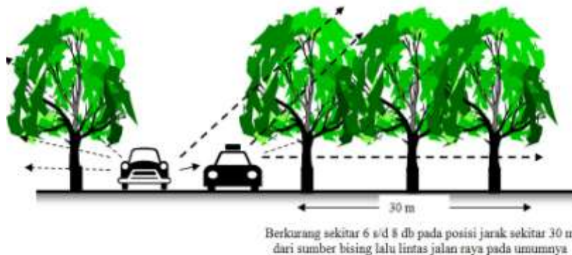
Gambar 4 : Pemanfaatan jarak mengurangi kebisingan