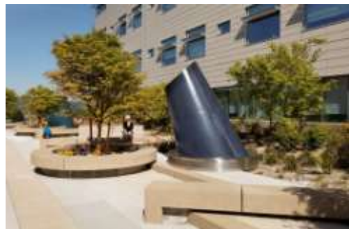
Gambar 6.3 Taman teras Randall Hospital

Bangunan amplop meliputi kaca kinerja tinggi dan meningkatkan isolasi termal yang melebihi Oregon Energi Kode standar energi minimum. Baja dan struktur beton, aluminium curtainwall dan bahan interior - seperti akustik, papan gipsum dan counter teraso cor di stasiun perawat - memiliki konten daur ulang yang signifikan. Bambu, produk cepat terbarukan, adalah standar untuk veneer, lantai dan langit-langit panel. Persistent racun bio-akumulatif