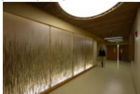
Gambar 3 koridor rumah sakit