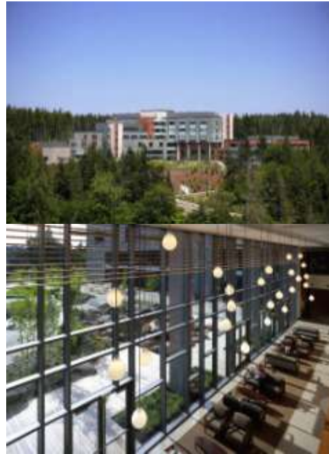
Gambar 6.3 St Anthony Hospital Sumber : www.archdaily.com Sumber : www.archdaily.com

Taman dan selasar yang luas selain sebagai fasilitas pendukung juga menjadi area buffer terhadap kebisingan ruang luar, dan menjadi area yang baik untuk evakuasi.