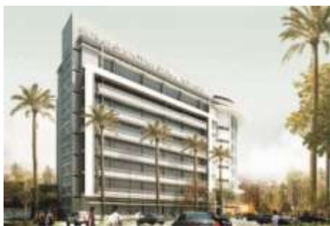
Gambar 2: Penggunaan Sunshading Sumber : PT.Global Rancang Selaras, “Arsitektur Rumah Sakit”

thermal. Untuk mengurangi panas matahari di Indonesia, bangunan diorientasikan membujur timur barat, bagian transparan atau bukaan diarahkan menghadap selatan dan utara sehingga lebih menghemat energy pendinginan. Pada kondisi tertentu kadang tidak dimungkinkan untuk meletakkan massa bangunan pada kondisi ideal diatas namun hal-hal ini dapat diatasi dengan penggunaan sunshading serta penggunaan material yang tepat (transparan atau bukaan seperti kaca dan jendela pada bagian yang tidak terpanaskan dan pasangan massif pada bagian yang terpanaskan).