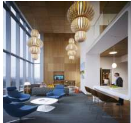
Gambar 6.2

Bangunan amplop meliputi kaca kinerja tinggi dan meningkatkan isolasi termal yang melebihi Oregon Energi Kode standar energi minimum. Baja dan struktur beton, aluminium curtainwall dan bahan interior - seperti akustik, papan gipsum dan counter teraso cor di stasiun perawat - memiliki konten daur ulang yang signifikan. Bambu, produk cepat terbarukan, adalah standar untuk veneer, lantai dan langit-langit panel. Persistent racun bio-akumulatif