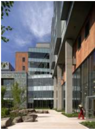
Gambar 6.3 Taman St. Anthony Hospital

Arsitek : Arsitek ZGF LLP Lokasi : Gig Harbor, Washington, Amerika Serikat Kontraktor Umum : Sellen Konstruksi Pengembang : The Hammes Perusahaan Insinyur Struktural I: PCS Solusi Struktural Mechanical Engineer : Insinyur CDi Electrical Engineer : Coffman Engineers Insinyur Sipil : DOWL Engineers Arsitek Lanskap : SiteWorkshop, Seattle Pemilik, Kedokteran Kantor Bangunan : Frauenschuh Kesehatan Solusi Real Estate Wilayah proyek : 250.000 sq ft