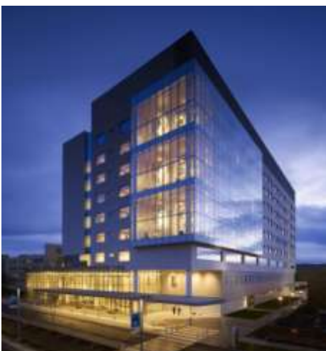
Gambar 6.1