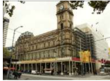
Gambar 10. Clock Tower of Melbourne's GPO yang mendominasi persimpangan Elizabeth & Bourke Street

Kota Manado mempunyai peluang yang sama untuk sukses dengan memperhatikan studi kasus di atas. Maksud perancangan kali ini mencoba menghadirkan sebuah properti komersial yang berbeda dari bangunan-bangunan komersial yang sudah ada sebelumnya. Masalah yang muncul saat ini adalah perpaduan antara dua teori/paham yang saling bertolak belakang ; Klasik dan Modern. Berikut ciri-ciri seni modern dan klasik :