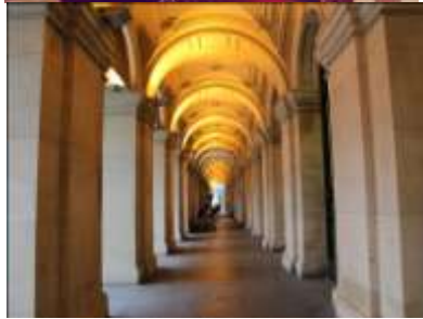
Gambar 9. Cafe yang terletak di sepanjang arcade bangunan

Selama berdiri menjadi bangunan komersil bergaya Klasik-Renaissance di Australia, Melbourne's GPO saat ini menjadi daya tarik tersendiri bagi pengunjung dan merupakan bangunan dengan konseptual Eropa-klasik yang sukses dibangun di ibukota benua Australia. Ditambah dengan menara jam yang khas dan mendominasi persimpangan dua jalan, bangunan ini semakin mencuri perhatian bagi siapa yang memperhatikannya.