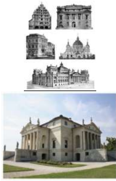
Gambar 1. Bangunan Renaissance yang memperlihatkan tiang-tiang gaya klasik

dasar teori yang diterapkan pada karya-karya masa Renaissance .