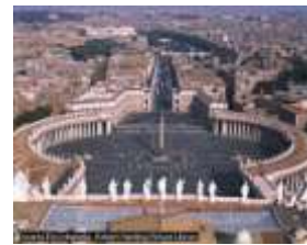
Gambar 6. Katedral Basilika St. Petrus di Roma