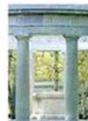
Konstruksi dinding pemikul dengan tiang Dorik