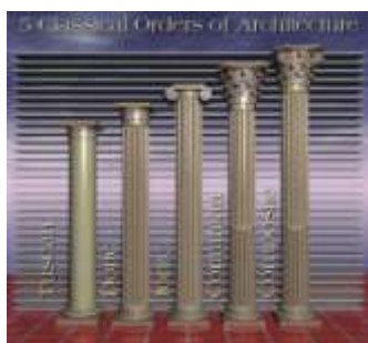
Gambar 5. Lima jenis Orde (kolom) yang dipakai pada zaman klasik

Ada lima Orde dalam arsitektur yang dikenal sampai sekarang yaitu, Tuscan, Doric, Ionic, Corinthian dan Composit. Orde Tuscan , berasal dari kuil-kuil Etruscan yang merupakan bentuk paling primitif dari ornamen kolom. Orde Doric , berasal dari kelompok suku bangsa Doria (turunan Italia dan Sisilia), bentuk dari orde doric kelihatan kokoh, kuat, sebagai lambang kekuasaan. Orde Ionic , berasal dari suku bangsa Ionia (Turunan Asia Kecil). Orde Korinthian , merupakan hasil ambisi dari kaum aristokrat kota Korhintia yang kaya dan makmur pada abad 5 SM. Orde Komposit , merupakan perpaduan dari Orde Korhintian dan Ionic sehingga kelihatan lebih mewah dan anggun.