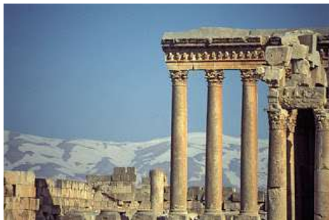
Gambar 4. Tiang-tiang / kolom dari Yunani yang merupakan ciri utama bangunan Renaissance

Ada lima Orde dalam arsitektur yang dikenal sampai sekarang yaitu, Tuscan, Doric, Ionic, Corinthian dan Composit. Orde Tuscan , berasal dari kuil-kuil Etruscan yang merupakan bentuk paling primitif dari ornamen kolom. Orde Doric , berasal dari kelompok suku bangsa Doria (turunan Italia dan Sisilia), bentuk dari orde doric kelihatan kokoh, kuat, sebagai lambang kekuasaan. Orde Ionic , berasal dari suku bangsa Ionia (Turunan Asia Kecil). Orde Korinthian , merupakan hasil ambisi dari kaum aristokrat kota Korhintia yang kaya dan makmur pada abad 5 SM. Orde Komposit , merupakan perpaduan dari Orde Korhintian dan Ionic sehingga kelihatan lebih mewah dan anggun.