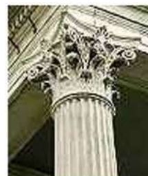
Tiang Ionik Yunani