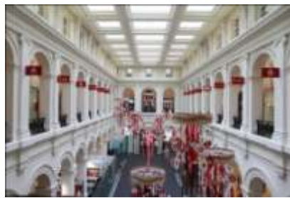
Gambar 8. Melbourne's GPO , Australia - pusat perbelanjaan dan pusat fashion terbesar di Australia

Gambar di atas adalah Melbourne's GPO (General Post Office) yang adalah sebuah Mall/pusat perbelanjaan dan pusat fashion terbesar di Australia. Sesuai namanya, bangunan ini dulu merupakan sebuah kantor pos umum yang berubah fungsi menjadi pusat perbelanjaan. Terletak di Central Business District kota Melbourne tepatnya di sudut persimpangan Elizabeth dan Bourke Street , bangunan ini terdaftar sebagai salah satu Warisan Peninggalan Victoria ( Victorian Heritage Register ) karena memiliki sejarah berdirinya dan indah, sehingga membuat bangunan yang sedianya hanya berupa Mall ini bisa menjadi salah satu landmark kota dan merupakan titik acuan untuk ukuran jarak dari kota Melbourne. Desainnya mengungkapkan arsitektur klasik karena penggunaan kolom Doric di lantai pertama yang dibangun antara 1859-1867, lantai kedua menggunakan kolom Ionic dan lantai ketiga menggunakan kolom Korintia. Cafe mengisi barisan tiang luar sementara toko-toko butik mengisi lantai tiga bangunan. Bangunan ini membentuk arcade utama sepanjang Bourke Street hingga Little Bourke Street .