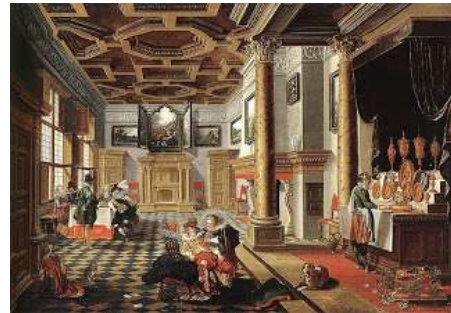
Gambar 3. Elemen dekoratif pada interior bangunan bergaya Renaissance

penginterpretasian alam dan sosok manusia, flora, fauna serta pemandangan alam. Pada ruang dalam, bagian dinding dan langit-langit umumnya dilapisi ukiran ( stucco ) yang obyeknya seputar flora, sosok dan perilaku dari fauna dan manusia, topeng-topeng, perahu maupun perisai.