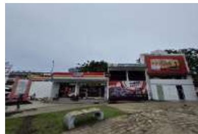
Gambar 12. Ancillary Services (Layanan Pendukung) Monumen Dotu Lolong Lasut (Hasil Survey, 2025)

Layanan pelengkap (ancillary services) yang ada di Monumen Dotu Lolong Lasut belum terdapat pos keamanan khusus di sekitar monumen, namun kawasan ini berada dalam area publik yang relatif ramai dan sering diawasi oleh petugas lapangan dari pemerintah kota atau satuan kebersihan taman.