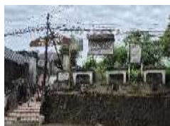
Gambar 23. Amenities (Amenitas) Makam Kanjeng Ratu Sekar Kedaton (Hasil Survey, 2025)