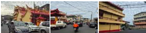
Gambar 27. Accesibility (Aksesibilitas) Klenteng Ban Hin Kiong (Hasil Survey, 2025)

D.I Panjaitan. Lokasinya di jalur satu arah beraspal baik dan dapat dijangkau dengan angkutan umum maupun kendaraan pribadi, memudahkan pengunjung untuk beribadah maupun berwisata budaya.