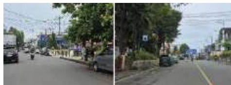
Gambar 14. Accesibility (Aksesibilitas) Gereja GMIM Sentrum Manado (Hasil Survey, 2025)

lokasinya strategis di dekat Jalan Sudirman dan Jalan Sarapung yang memiliki kondisi jalan baik dan lalu lintas lancar. Akses dapat menggunakan kendaraan pribadi maupun transportasi umum, sehingga memudahkan kunjungan masyarakat dan wisatawan, sekaligus meningkatkan daya tarik pariwisata di kawasan ini.