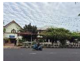
Gambar 35. Ancillary Services (Layanan Pendukung) Katedral Katolik (Hasil Survey, 2025)

Katedral Manado belum memiliki pos keamanan atau pusat informasi wisata, namun di seberangnya terdapat kapel yang memperkaya fungsi kawasan, meski layanan pendukung tetap berfokus pada aktivitas keagamaan.