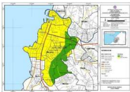
Gambar 4. Peta Morfologi Kecamatan Wenang (RTRW Kota Manado Tahun 2023-2043)