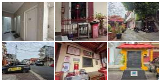
Gambar 28. Amenities (Amenitas) Klenteng Ban Hin Kiong (Hasil Survey, 2025)

Klenteng Ban Hin Kiong memiliki fasilitas pendukung seperti area parkir dengan petugas, toilet, tempat sampah, dan papan informasi. Fasilitas ini mendukung kenyamanan umat beribadah sekaligus mempermudah kunjungan wisatawan yang ingin menikmati budaya Tionghoa.