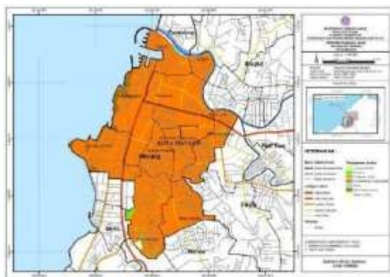
Gambar 5. Peta Penggunaan Lahan Kecamatan Wenang (RTRW Kota Manado Tahun 2023-2043)