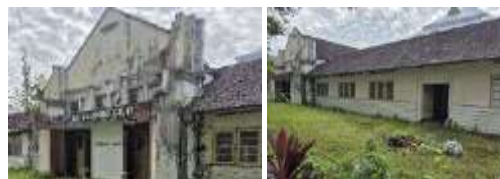
Gambar 30. Atraksi (Attraction) Gedung Minahasa Raad (Hasil Survey, 2025)

Gedung Minahasa Raad dekat Zero Point Manado adalah bangunan bersejarah peninggalan kolonial yang pernah menjadi dewan rakyat. Kini kondisinya memprihatinkan, dengan halaman terbengkalai, interior rusak, dan koleksi bersejarah yang terabaikan. Meski menyimpan nilai historis penting dan berpotensi menjadi daya tarik wisata budaya, gedung ini belum dimanfaatkan secara optimal.