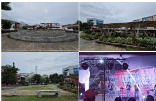
Gambar 9. Atraksi (Attraction) Monumen Dotu Lolong Lasut (Hasil Survey, 2025)