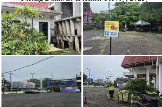
Gambar 15. Amenities (Amenitas) Gereja GMIM Sentrum Manado (Hasil Survey, 2025)