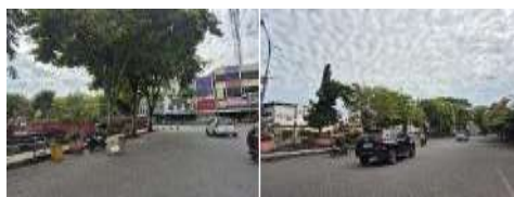
Gambar 10. Accesibility (Aksesibilitas) Monumen Dotu Lolong Lasut (Hasil Survey, 2025)

Monumen Dotu Lolong Lasut memiliki Tingkat aksesibilitas yang tinggi karena letaknya yang berada di pusat kawasan kota lama Manado, tepatnya di jalur strategis kawasan perdagangan dan jasa. Lokasinya dapat dijangkau dengan mudah melalui berbagai moda transportasi.