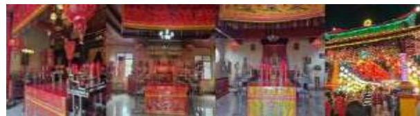
Gambar 26. Atraksi (Attraction) Klenteng Ban Hin Kiong (Hasil Survey, 2025)

Klenteng Ban Hin Kiong di Manado menjadi pusat ibadah umat Tridharma sekaligus daya tarik budaya melalui arsitektur khas dan beragam ritual, seperti Sembahyang Imlek, Goan Siao, Cio Ko, serta perayaan lain termasuk Festival Kue Bulan. Selain fungsi religius, klenteng ini juga menawarkan pengalaman budaya yang memperkaya pariwisata kota.