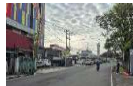
Gambar 25. Accessibility (Aksesibilitas) Waruga Mahakeret Barat (Hasil Survey, 2025)

Waruga Mahakeret Barat strategis di pusat Kota Manado dan mudah diakses lewat jalan raya, namun letaknya di sudut depan hotel tanpa penanda jelas membuat situs ini kurang terlihat dan jarang disadari pengunjung.