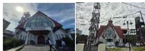
Gambar 13. Atraksi (Attraction) Gereja GMIM Sentrum Manado (Hasil Survey, 2025)

GMIM Sentrum Manado adalah gereja bercorak khas Protestan Belanda berbentuk persegi, melambangkan empat penjuru mata angin. Meski telah beberapa kali direnovasi, termasuk pemindahan mimbar, keaslian elemen arsitektur seperti dinding dan pilar tetap terjaga. Selain sebagai pusat ibadah, gereja ini menjadi objek wisata religi dan landmark penting yang memadukan nilai spiritual, budaya, dan sejarah di Kota Manado.