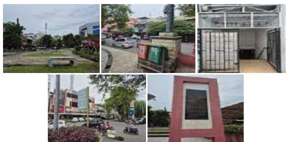
Gambar 11. Amenities (Amenitas) Fasilitas dan Penanda Informasi Objek Monumen Dotu Lolong

Amenitas di sekitar Monumen Dotu Lolong Lasut cukup lengkap, meliputi bangku taman, tempat sampah, toilet umum, serta papan penanda dan informasi yang memudahkan pengenalan monumen. Fasilitas ini mendukung kenyamanan pengunjung dan memperkuat fungsi monumen sebagai ruang publik yang ramah wisatawan.