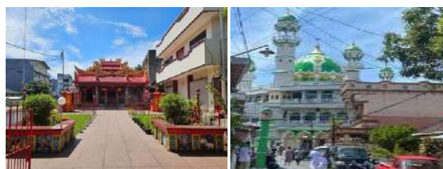
Gambar 6. Klenteng Ban Hin Kong dan

Selain Kampung Cina, di Kecamatan Wenang juga terdapat Kelurahan Istiqlal yang lebih dikenal sebagai Kampung Arab, salah satu tradisi budaya yang menonjol adalah Iwadh, sebuah kegiatan tahunan yang dilaksanakan setiap tanggal 2 Syawal, tepat sehari setelah Idulfitri, sebagai penutup rangkaian ibadah Ramadhan.