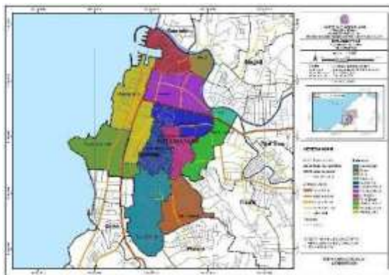
Gambar 1. Peta Lokasi Penelitian (Peneliti 2025)

Lokasi dalam penelitian ini terletak di Kecamatan Wenang, Kota Manado