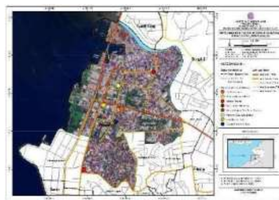
Gambar 8. Peta Sebaran Objek Cagar Budaya di Kawasan Pusat Kota Lama Manado (Hasil Analisis 2025)

Dalam penelitian ini, teridentifikasi terdapat 4 objek yang dinyatakan sebagai Objek Cagar Budaya yaitu Monumen Dotu Lolong Lasut, GMIM Sentrum Manado, Makam Kanjeng Ratu Sekar Kedaton, dan Waruga Makeret Barat. Dan diidentifikasi juga beberapa objek yang dinyatakan sebagai Objek Diduga Cagar Budaya yaitu Tugu Perang Dunia II, Klenteng Ban Hin Kiong, Minahasa Raad, dan Katedral Katolik.