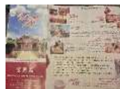
Gambar 29. Ancillary Services (Layanan Pendukung) Klenteng Ban Hin Kiong (Hasil Survey, 2025)

agenda tahunan, dan kontak klenteng, sehingga kunjungan menjadi lebih aman dan informatif.