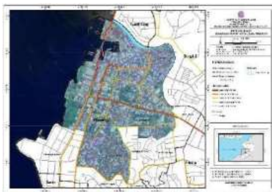
Gambar 7. Peta Deliniasi Kawasan Pusat Kota Lama Manado (Hasil Analisis 2025)

Seiring berjalannya waktu, setelah kemerdekaan Indonesia, kawasan Wenang terus memainkan peran penting sebagai pusat perkotaan. Penetapan kawasan Wenang sebagai pusat kota lama didasarkan pada faktor historis dan strategis, seperti perannya dalam pemerintahan kolonial, perdagangan, penyebaran agama, serta akses terhadap sumber daya lokal. Kawasan ini memiliki nilai sejarah yang penting sebagai cikal bakal Kota Manado, sekaligus menjadi representasi identitas budaya dan media edukasi lintas generasi di Sulawesi Utara.