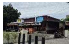
Gambar 16. Ancillary Services (Layanan Pendukung) Gereja GMIM Sentrum Manado (Hasil Survey, 2025)

GMIM Sentrum Manado belum memiliki pusat informasi wisata maupun pos keamanan khusus, namun tersedia kafetaria yang menyajikan hidangan khas Manado hingga menu internasional. Fasilitas ini tidak hanya melayani jemaat, tetapi juga menarik bagi pengunjung, sehingga menambah kenyamanan dan daya tarik wisata religi meski layanan pendukung formal masih terbatas.