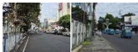
Gambar 31. Accesibility (Aksesibilitas) Gedung Minahasa Raad (Hasil Survey, 2025)

Gedung Minahasa Raad mudah diakses karena berada di Jalan Sam Ratulangi, pusat Kota Manado, dekat Tugu Zero Point, dan dapat dijangkau kendaraan pribadi maupun umum. Namun, kondisi bangunan yang terbengkalai membuat potensinya sebagai destinasi wisata budaya belum tergarap.