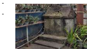
Gambar 24. Atraksi (Attraction) Waruga Mahakeret Barat (Hasil Survey, 2025)