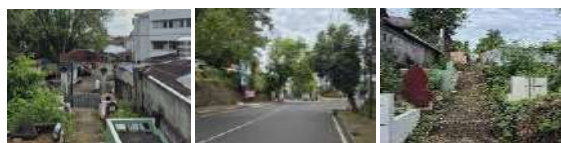
Gambar 22. Accesibility (Aksesibilitas) Makam Kanjeng Ratu Sekar Kedaton (Hasil Survey, 2025)

Makam Kanjeng Ratu Sekar Kedaton mudah diakses karena berada di tepi Jalan Diponegoro dekat Masjid Raya Ahmad Yani. Pengunjung cukup menempuh jalur pendek sedikit menanjak, dapat menggunakan kendaraan pribadi maupun transportasi umum, meski lalu lintas sekitar ramai pada hari besar keagamaan.