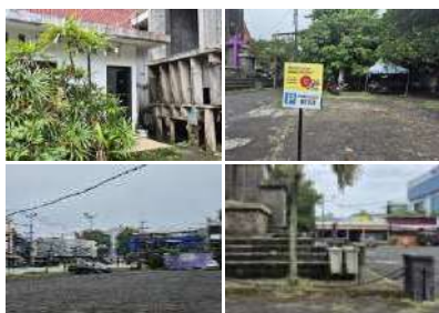
Gambar 19. Amenities (Amenitas) Tugu Perang Dunia ke II (Hasil Survey, 2025)

Fasilitas di sekitar Tugu Perang Dunia II terintegrasi dengan GMIM Sentrum Manado, meliputi area parkir, toilet, tempat sampah, serta papan informasi sejarah dan identitas monumen. Amenitas ini mendukung kenyamanan pengunjung sekaligus memperkuat nilai sejarah dan daya tarik wisata tugu sebagai bagian penting dari pusat Kota Lama Manado.