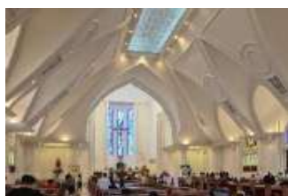
Gambar 32. Atraksi (Attraction) Katedral Katolik (Hasil Survey, 2025)

Katedral Katolik Manado bergaya arsitektur Gothic dengan konsep “Istana Surga,” ditandai pintu utama besar dan kubah ala gereja Roma. Desain megah dan sakral ini menjadikannya pusat ibadah sekaligus objek wisata religi yang menarik.