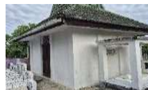
Gambar 21. Atraksi (Attraction) Makam Kanjeng Ratu Sekar Kedaton (Hasil Survey, 2025)

Makam Kanjeng Ratu Sekar Kedaton di Manado merupakan objek wisata religi sekaligus cagar budaya bersejarah. Terletak di area pemakaman umum, bangunan bercat putih ini menyimpan makam Permaisuri Sri Sultan Hamengkubuwono V dan putranya. Akses masuk hanya dengan izin juru kunci karena dianggap keramat. Dilengkapi gapura dan papan informasi, makam ini menjadi daya tarik bagi peziarah sekaligus sumber pengetahuan sejarah dan budaya lokal.