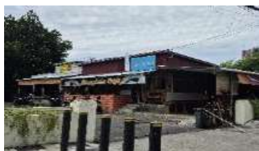
Gambar 20. Ancillary Services (Layanan Pendukung) Tugu Perang Dunia ke II (Hasil

Layanan pendukung Tugu Perang Dunia II terintegrasi dengan GMIM Sentrum Manado, tanpa pusat informasi atau pos keamanan khusus. Namun, pengunjung tetap dapat memanfaatkan kafetaria di lingkungan gereja yang menyediakan berbagai makanan dan minuman.