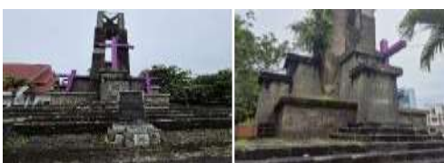
Gambar 17. Atraksi (Attraction) Tugu Perang Dunia ke II (Hasil Survey, 2025)

GMIM Sentrum Manado memiliki fasilitas pendukung seperti lahan parkir, toilet umum, dan tempat sampah untuk kenyamanan jemaat dan pengunjung. Papan identitas cagar budaya sempat dilepas karena renovasi pagar, namun lokasi gereja tetap mudah ditemukan berkat rambu lalu lintas di sekitarnya. Fasilitas ini mendukung kenyamanan beribadah sekaligus pengalaman positif wisatawan.