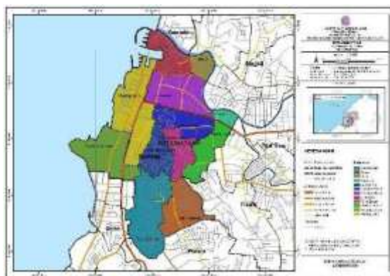
Gambar 2. Peta Administrasi Kecamatan Wenang (RTRW Kota Manado Tahun 2023-2043)

Kecamatan Wenang merupakan salah satu kecamatan di Kota Manado. Kecamatan ini merupakan daerah pusat kota lama dan sekaligus pusat perdagangan dengan kompleks pertokoan. Secara administrasi, Kecamatan Wenang terdiri dari 12 Kelurahan dengan luas wilayah sebesar 3,64 Km 2 .