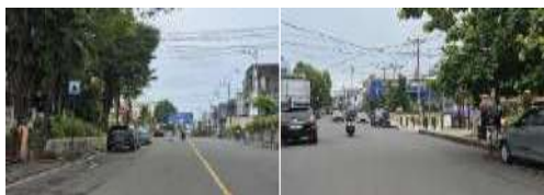
Gambar 18. Accessibility (Aksesibilitas) Tugu Perang Dunia ke II (Hasil Survey, 2025)