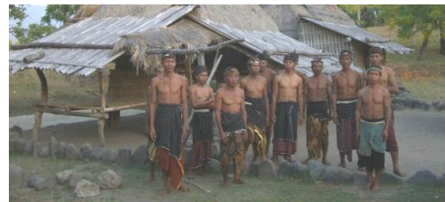
Gambar 8 Pemimpin Adat pada Tanah Petak Daye

dengan sistem kepercayaan, sistem sosial serta sistem ekonomi masyarakat tersebut. Dari observasi penggunaan beruqaq sehari-hari secara umum, ditemukan bahwa seluruh beruqaq digunakan sebagai tempat berkumpul warga, terutama kaum pria. Bahkan beruqaq menjadi ruang tidur pada malam hari untuk pemuda yang belum menikah. Secara khusus, penggunaan bangunan beruqaq dalam keseharian masyarakat dapat dibagi menjadi dua yaitu beruqaq yang terletak di Tanah Biasa digunakan dalam kehidupan sehari-hari masyarakat Tanah Petak Daye, sedangkan beruqaq yang terletak Tanah Adat hanya digunakan pada saat-saat tertentu dan digunakan oleh para pemimpin adat (Gambar 8).