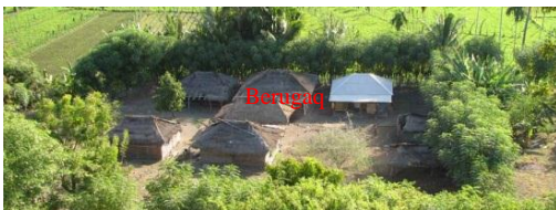
Gambar 11 Salah satu bentuk kelompok hunian pada Tanah Biasa, Tanah Petak Daye.

Penggunaan berugaq sebagai bale berkumpul kaum pria berpengaruh terhadap tatanan permukiman. Berugaq menjadi salah satu pusat orientasi tatanan permukiman masyarakat di Tanah Biasa. Dari hasil observasi di lapangan, masyarakat membagi permukiman mereka menjadi kelompok yang lebih kecil-kecil. Kelompok permukiman ini dibatasi oleh pagar tanaman dan didasarkan oleh unsur kekerabatan (Fitriana, 1997, h. 21). Sebuah kelompok hunian pada Tanah Biasa terdiri dari beberapa rumah, beberapa kandang dengan satu atau dua buah berugaq (Gambar 11). Berugaq berada di tengah tatanan, menjadi pusat orientasi massa hunian (Gambar 12).