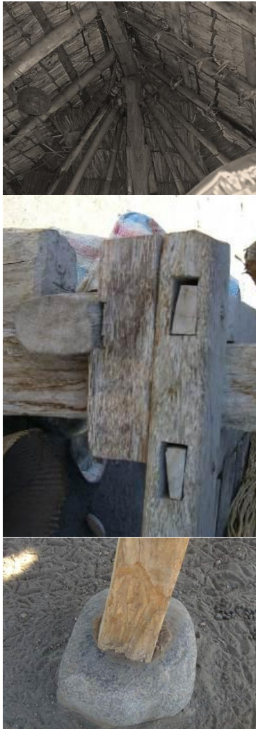
Gambar 7 Material dan konstruksi beruqaq

Jadi terdapat dua tipe dasar beruqaq yaitu beruqaq secepat dan sekenem dengan varian berdasarkan tata ruangnya; 1 ruang dan 3 ruang.