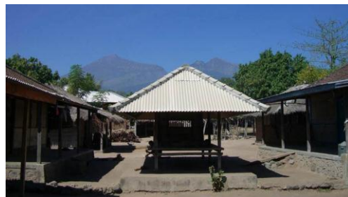
Gambar 14 Berugaq yang masih berorientasi ke Gunung Rinjani di Tanah Biasa

Seiring dengan perkembangan mata pencaharian penduduk Desa Tanah Petak Daye, mulai dari penambang batu bara hingga menjadi petani bawang, jagung, dan lain sebagainya, penggunaan berugaq dari yang hanya digunakan sebagai bale berkumpul kaum pria dan tanpa dinding, juga berkembang, ditambah dengan dinding untuk