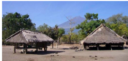
Gambar 13 Berugaq dan hunian berorientasi ke Gunung Rinjani di Tanah Adat

bangunan berugaq , orientasi dari seluruh bangunan berugaq adalah ke Gunung Rinjani, baik yang berada di Tanah Adat (Gambar 13) maupun Tanah Biasa (Gambar 14). Sedangkan bangunan lainnya yang berupa hunian di Tanah Biasa, sudah tidak lagi berorientasi ke Gunung Rinjani. Dalam kepercayaan masyarakat Tanah Petak Daye, Gunung Rinjani dianggap sebagai tempat bersemayamnya Tuhan dan roh-roh leluhur (Fitriana, 1997, h. 21).