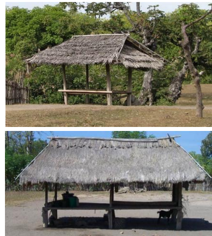
Gambar 5 Beruqaq secepat (atas) pada Tanah Biasa dan Beruqaq sekenem (bawah) pada Tanah Adat

hingga membentuk segi enam merupakan kolom utama untuk beruqaq . Kolom-kolom ini disambung hanya dengan menggunakan pola pasak kayu. Masing-masing kolom kayu ini bertumpu diatas sebuah batu sebagai pondasi dari beruqaq ini. Lantai beruqaq merupakan sebuah bidang dari bilah-bilah bambu yang dinaikkan setinggi 80 cm dari permukaan tanah sehingga nyaman untuk dipakai duduk. Penutup atapnya biasanya masyarakat menggunakan ijuk.