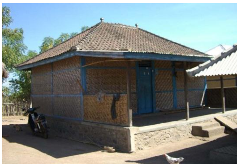
Gambar 4 Salah satu rumah di Tanah Biasa, desa Tanah Petak Daye

Menurut hasil wawancara masyarakat setempat, kelompok massa bangunan penjaga adat dipercaya lebih sakral daripada kelompok massa bangunan pemimpin adat. Hal ini dapat dilihat dari aturan-aturan yang harus ditaati dalam kelompok massa bangunan ini, yaitu setiap orang harus mengenakan baju lokal Tanah Petak Daye dan tidak diperbolehkan menggunakan pakaian dalam.