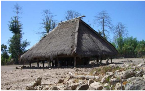
Gambar 3 Salah satu rumah pemimpin adat di Desa Tanah Petak Daye