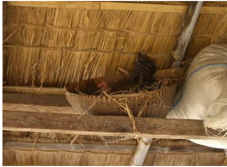
Gambar 15 Beruqaq yang digunakan sebagai area menjemur bawang dan kandang ayam di bawah atap pada Tanah Biasa.

menjemur bawang hingga terdapat kandang ayam dalam atap beruqaq (Gambar 15).