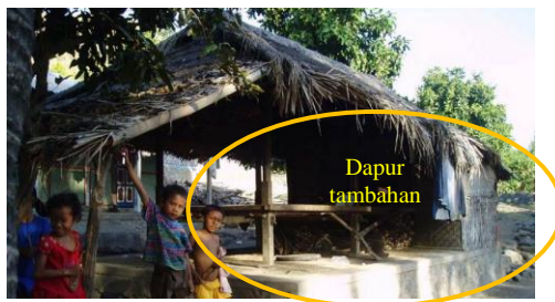
Gambar 16 Tambahkan dapur pada Beruqaq sebagai contoh pergeseran nilai gender

Selain itu, dengan bertambahnya pengetahuan akan cara-cara memasak dan peralatannya, beruqaq juga digabung dengan fungsi dapur, kegiatan memasak yang dilakukan oleh kaum wanita. Dengan demikian, beruqaq sebagai simbolisasi area pria pada tatanan permukiman semakin berkurang dan membur. Meskipun demikian, pada saat pengamatan di lapangan, jika pria berkumpul di beruqaq , para wanita akan pindah keluar dari beruqaq dan duduk di sekitar beruqaq .