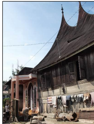
Gambar 1 Arsitektur Minangkabau dengan rumah tinggal Mediteranian Style di Padang Pariaman.

Modernisasi, urbanisasi dan globalisasi (termasuk pertukaran informasi yang sangat cepat) merupakan tiga hal yang mempengaruhi perubahan arsitektur sebagai wadah kehidupan sehari-hari manusia. Perubahan ini terjadi di seluruh dunia, termasuk di pelosok-pelosok Indonesia. Arsitektur Limasan di Jawa Tengah kemudian diganti menjadi bangunan rumah tinggal tipe 21 dan/atau tipe 36. Begitu pula, arsitektur Minangkabau di Padang Pariaman, Sumatra Selatan diganti menjadi rumah tinggal tipe Mediteranian Style (Gambar 1).