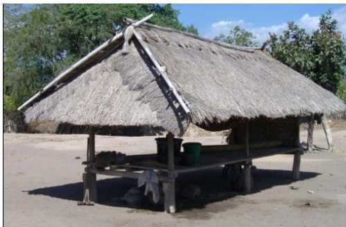
Gambar 9 Berugaq Agung Perumbak (sebelah kiri) dan Berugaq Agung (sebelah kanan)

Berugaq Agung Perumbak hanya digunakan oleh para pemimpin adat untuk rapat dan pertemuan-pertemuan khusus. Seperti yang telah dibahas sebelumnya, berugaq ini dibuat dengan bentuk dan ruang yang berbeda, yang ditandai dengan adanya tambahan tempat duduk seperti teras dan atap tambahan yang terbuat dari bambu. Sedangkan berugaq Agung digunakan oleh para pemimpin adat ( pembekel ) untuk bertemu