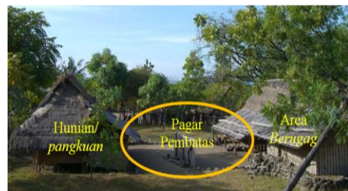
Gambar 10 Pagar pembatas, yang menjadi salah satu pemisah antara area pria, berugaq dan area wanita yaitu rumah.

Dalam kehidupan sehari-hari masyarakat Tanah Petak Daye, berugaq (selain berugaq Agung dan berugaq Agung Perumbak ) digunakan sebagai area berkumpul pria. Dari data observasi di lapangan, selain sebagai tempat bersosialisasi, kaum pria juga menggunakan berugaq untuk tidur di malam hari. Hampir semua lelaki, dimulai dari anak-anak hingga dewasa, tidur di berugaq untuk menjaga keamanan desa ataupun karena udara malam hari yang cukup panas. Tidaklah mengherankan jika berugaq merupakan area pria, wanita tidak diperbolehkan untuk duduk-duduk pada berugaq ini. Hal ini semakin terlihat dengan adanya pagar pemisah (gambar 10) antara hunian atau disebut juga pangkuan dengan berugaq . Dengan demikian, berugaq merupakan symbol pria atau laki-laki dan hunian sebagai representasi dari wanita. Hal ini merupakan bentuk dari perbedaan gender yang berlaku pada masyarakat Tanah Petak Daye.