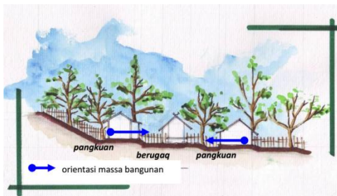
Gambar 12 Hunian di Tanah Biasa berorientasi pada berugaq , berbeda dengan Tanah Adat, semua orientasi hunian yang berorientasi ke Gunung Rinjani.

Berbicara mengenai orientasi, seperti yang teridentifikasi pada klasifikasi bentuk