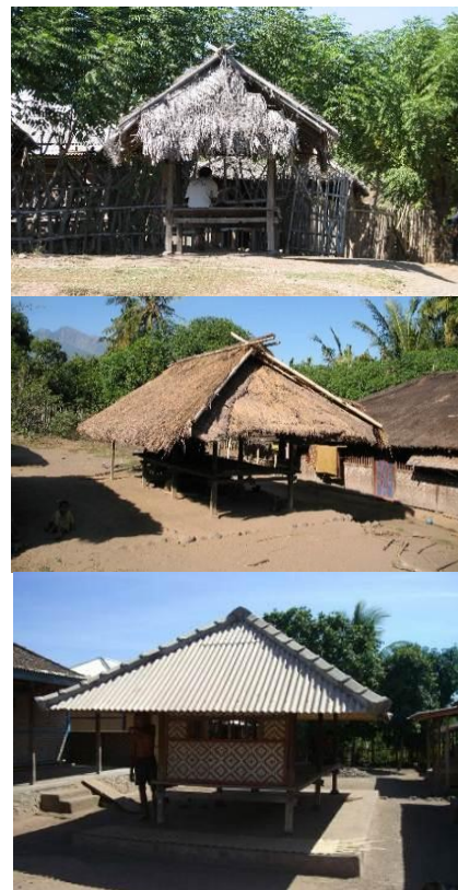
Gambar 17 Variasi beruqaq dengan jumlah kolom dan penggunaan yang berbeda sebagai simbol kemakmuran dalam Masyarakat Tanah Petak Daye.

pertukaran informasi, dan modernisasi, penggunaan material untuk menutup atap beruqaq juga berubah. Bentuk, besaran, dan penggunaan material pada beruqaq sering diasosiasikan menjadi lambang kemakmuran dalam masyarakat. Dimulai dari jumlah kolom, hingga material penutup atap digunakan untuk menyimbolkan kekayaan seseorang. Semakin banyak jumlah kolomnya dan semakin modern material yang digunakan, maka semakin tinggi pula nilai kemakmuran keluarga yang memilikinya. Hal ini teridentifikasi melalui pengamatan di lapangan; seringkali beruqaq mereka direnovasi dan dirawat dengan baik lebih daripada rumah tinggal mereka.