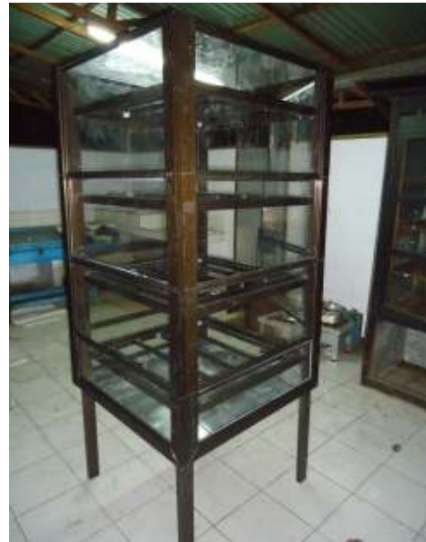
Gambar 1. Alat pengering ikan tenaga surya sistem bongkar-pasang.

Dalam proses pembuatan alat pengering ikan, tahapan yang dilakukan yaitu merancang desain alat, pemilihan dan pembelian bahan, pembuatan alat, menghitung kapasitas alat, menghitung anggaran pembuatan alat dan mengetahui manfaat alat pengering ikan.