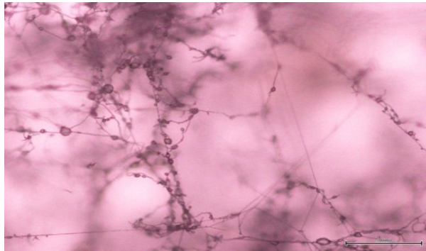
Gambar 3. Bentuk Fusarium sp di bawah mikroskop dengan pembesaran 100x.

Pada Gambar 3. Kapang Fusarium sp terlihat seperti benang-benang saja. Kapang di atas diinkubasi selama 7 hari dimana kapang Fusarium sp tumbuh bersamaan dengan Aspergillus sp (Berbentuk pentul pada ujungnya) dengan suhu inkubasi 30°C. Bentuk dan struktur kapang di atas merupakan penampakan secara mikroskopik yaitu dengan menggunakan mikroskop Olympus CX 41 dengan pembesaran 100x.