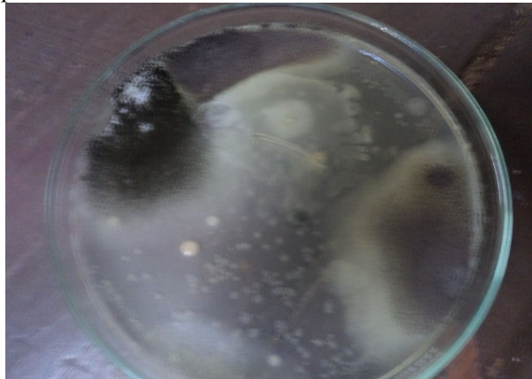
Gambar 1. Pertumbuhan kapang pada media PDA yang diamati hari ke 7.

Cappucino dan Sherman (1992) bahwa Aspergillus sp., mempunyai warna kehijauan, hitam dan cokelat. Untuk menentukan jenis kapang yang tumbuh dilakukan pengamatan di bawah mikroskop Olympus CX41 dengan pembesaran 100x dan membandingkan dengan struktur morfologi menurut Cappucino dan Sherman (1992). Hasil identifikasi kapang yang tumbuh pada ikan Terbang asin dapat dilihat pada Tabel 3.