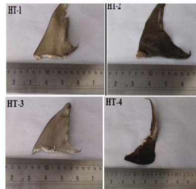
Gambar 1. Bentuk dan tampilan sirip punggung ikan hiu yang didapat pengumpul di Tanawangko, Kabupaten Minahasa.

Total sirip yang diperoleh dari pengumpul sirip di Tanawangko Minahasa, berjumlah 4 buah sirip punggung dengan kode sirip HT-1, HT-2, HT-3 dan HT-4 (Gambar 1)