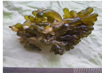
Gambar 9. Valonia aegagropila

Talus mempunyai bentuk yang lurus, berwarna hijau kecokelatan, vesikula tidak beraturan, bergerombol dan belapis-lapis. Memiliki holdfast rhizoid terletak di permukaan bawah talus. Spesies zona mid-litoral yang menghuni daerah intertidal dangkal (Chaudhury et al. , 2019), substrat batu dan karang mati (Trono, 2016).