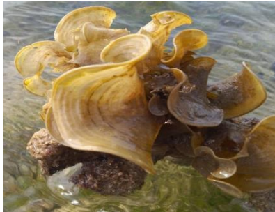
Gambar 11. Padina australis

Talus menyerupai kipas membentuk lobus. Blade datar dan terbelah, ujung menggulung, memiliki garis-garis radial di permukaan bawah, berwarna coklat muda. Holdfast tunggal. Berwarna coklat keputihan adanya kalsifikasi (JIRCAS, 2012). Menempati daerah intertidal hingga subtidal di substrat batu dan karang mati (Hawaii, 1996).