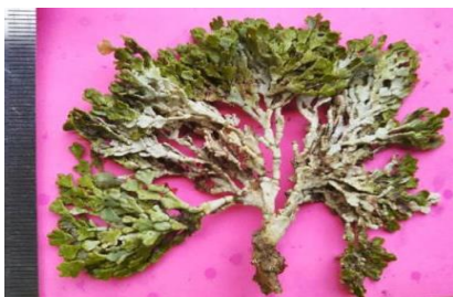
Gambar 5. Halimeda incrassata

Makroalga tegak lurus, tinggi 5- 6,5 cm dan lebar 7-9 cm, berwarna hijau muda, bersegmen padat dan berkapur. Blade berbentuk seperti kipas dan rimbun. Percabangan utama dikotom. Holdfast berbentuk seperti umbi yang berwarna kecokelatan. Hidup pada substrat berpasir dan karang mati (Pongparadon, 2009).