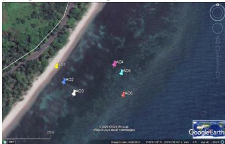
Gambar 2. Titik-titik Koordinat

Lokasi pengambilan sampel tersebar di enam titik-titik koordinat yaitu AO1 (01°09'10.1"LU dan 125°01'30.9"BT), AO2 (01°09'9.2"LU dan 125°01'31.4"BT), AO3 (01°09'08.6"LU dan 125°01'32.0"BT), AO4 (01°09'10.3"LU dan 125°01'34.2"BT), AO5 (01°09'09.8"LU dan 125°01'34.6"BT), AO6 (01°09'08.6"LU dan 125°01'34.7"BT). Pengambilan sampel dari pesisir paling dekat ke daratan hingga ke pesisir terjauh yang dekat dengan laut lepas (Gambar 2).