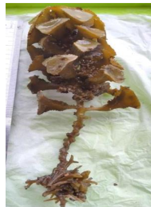
Gambar 10. Turbinaria decurrens

Talus tegak. Daun berbentuk segitiga/trigonous yang tampak jelas (Trono & Ganzon-Fortes, 1988). Holdfast terbentuk seperti rhizoid . memiliki bagian yang menyerupai untaian bunga pada