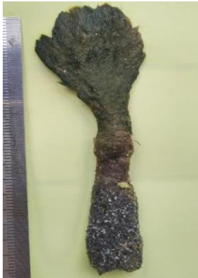
Gambar 7. Avrainvillea erecta

Talus berbentuk seperti pedang, tegak, agak tebal, halus, berwarna hijau tua dan memiliki tinggi 1-6 cm, lebar 2,5-10 cm. Blade terdiri dari filamen-filamen yang tidak keras, dan sangat lembut. Holdfast berbentuk seperti umbi (Titlyanov et al. , 2018). Alga hijau ini dapat tetap hidup di lumpur disebabkan alga memiliki holdfast yang dapat masuk hingga ke bagian dalam sedimen lumpur (Zainee et al. , 2019).