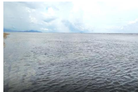
Gambar 3. Ekosistem Lamun di Zona Intertidal

Makroalga yang ditemukan berada di ekosistem lamun. Makroalga hidup bersama-sama. Pengamatan dilakukan saat surut terjauh sehingga pengamatan mudah dilakukan. Lamun yang ditemukan yaitu Syringodium , Cymodocea dan Enhalus . Lebar zona pengamatan sekitar 150 m dan panjang zona sekitar 100 m. Air di lokasi pengamatan memiliki pH kisaran 7- 8, salinitas 30 hingga 36 %. Salinitas semakin tinggi mendekati laut lepas. Hal ini disebabkan air daratan yang tawar memasuki air laut sehingga air laut di dekat daratan lebih rendah salinitasnya dibandingkan yang lebih ke laut. Substrat di lokasi pengamatan berupa pasir hingga pecahan karang yang telah mati (Gambar 3).