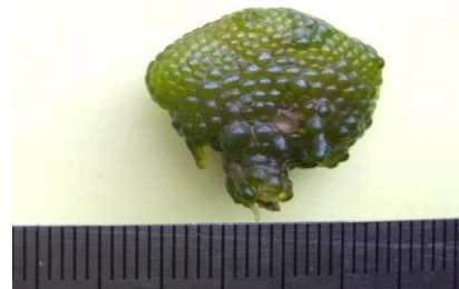
Gambar 6. Dictyosphaeria cavernosa

Bentuk talus padat, berwarna hijau, berdiameter 2-5 cm, lobus tidak teratur, berdinging tebal dan menggumpal, memiliki holdfast rhizoid yang berukuran kecil yang terdapat di bagian bawah permukaan talus. Organ ini berfungsi sebagai alat pelekak (Van Aalderen-Zen, 2016). Dictyosphaeria cavernosa atau alga gelembung hijau ini termasuk alga invasif dalam komunitas terumbu karang yang bernutrisi tinggi. Alga D. cavernosa ditemukan melekat pada pecahan karang di dataran dangkal, karang mati dan daerah pasang surut (Anonim, 2001; Van Aalderen-Zen, 2016).