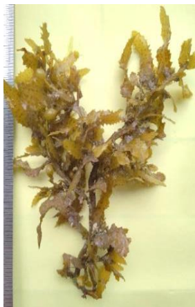
Gambar 12. Sargassum polycystum

Daun rata, melebar dan memiliki tulang daun utama/ midrib (Trono & Ganzon-Fortes, 1988). Talus berukuran