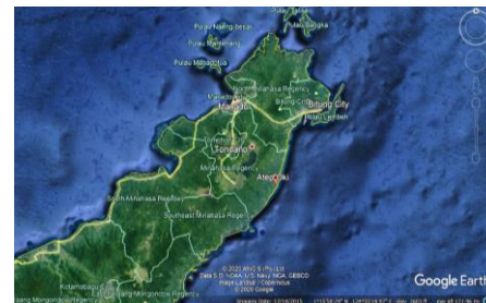
Gambar 1. Peta Lokasi

Penelitian ini dilaksanakan pada bulan Oktober 2019 sampai Januari 2020. Pengambilan sampel dilaksanakan di Pesisir Atep Oki, Desa Atep Oki, Kecamatan Lembean Timur, Kabupaten Minahasa, Sulawesi Utara (Gambar 1). Sampel lalu diidentifikasi di Laboratorium Lanjut, Jurusan Biologi Fakultas Matematika dan Ilmu Pengetahuan Alam, Universitas Sam Ratulangi, Manado, Sulawesi Utara.