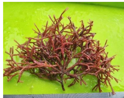
Gambar 13. Tricleocarpa fragilis

Talus mudah patah, rimbun, berwarna ungu muda, tinggi 6-12 cm, percabangan dikotom teratur yang terdiri dari segmen berbentuk silinder dan halus dengan panjang 5-6 mm. Holdfast berukuran kecil dan tidak berbentuk (Titlyanov et al. , 2018). Habitat alga ini berupa substrat batu dan karang mati (Titlyanov et al. , 2018), cangkang moluska dan di daerah intertidal (Guiry, 2020).