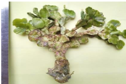
Gambar 4. Halimeda macroloba

Halimeda adalah genus makroalga hijau yang penting, terkalsifikasi dan berasosiasi dengan habitat terumbu karang tropis. Spesies Halimeda tersebar luas di seluruh terumbu pada daerah subtidal dan pada kedalaman lebih dari 100 m dan dapat membentuk populasi dalam jumlah besar. Sekitar 75% dari spesies Halimeda lebih suka pada habitat kerikil daripada pasir atau lumpur.