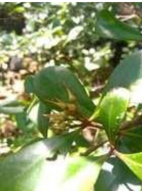
Gambar 1. Mangrove A. marina (A) dan A. floridum (B)