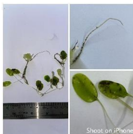
Gambar 5. Halophila ovalis