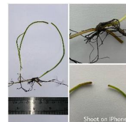
Gambar 7. Syringodium isoetifolium