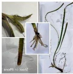
Gambar 2. Enhalus acoroides

Berdasarkan dari hasil penelitian yang dilakukan di perairan Desa Darunu, Kecamatan Wori, Kabupaten Minahasa Utara bahwa ada 6 jenis lamun yang ditemukan di lokasi penelitian yaitu Enhalus acoroides , Thalassia hemprichii , Cymodocea rotundata , Halophila ovalis , Halodule pinifolia dan Syringodium isoetifolium .