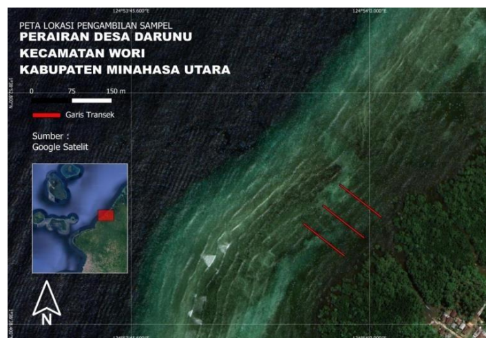
Gambar 1. Peta lokasi penelitian.

Penelitian ini dilakukan di Perairan Desa Darunu, Minahasa Utara (Gambar 1). Penelitian ini dilakukan pada bulan Agustus 2022, dengan mengambil titik koordinat pada masing-masing transek yaitu transek 1 1°38'42,7" BT, 124°53'58,5" LU, transek 2 1°38'43,8" BT, 124°53'59,7" LU dan transek 3 1°38'45.1" BT, 124°54'00,7" LU.