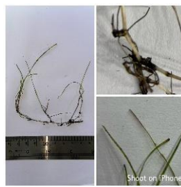
Gambar 6. Halodule pinifolia