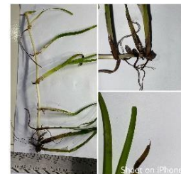
Gambar 4. Cymodocea rotundata