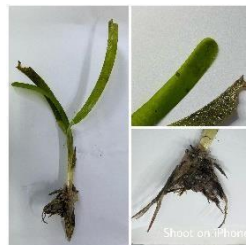
Gambar 3. Thalassia hemprichii