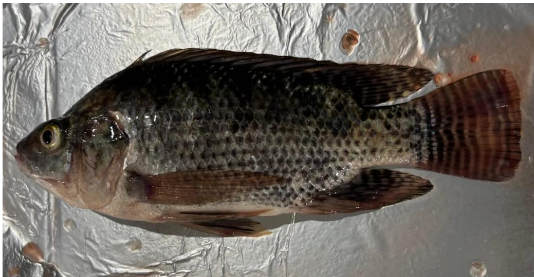
Gambar 1. Ikan nila ( Oreochromis niloticus )

Penyakit yang sering dilaporkan adalah Motile Aeromonas Septicemia (MAS) yang disebabkan oleh Aeromonas hydrophila , yang merupakan bakteri patogen oportunistik yang umum ditemukan pada lingkungan perairan budidaya (Stratev & Odeyemi, 2017). Infeksi A. hydrophila dapat menyebabkan hemoragi, ulserasi, septisemia, penurunan pertumbuhan, hingga kematian ikan dalam jumlah besar (Austin & Austin, 2016). Tingkat infeksi A. hydrophila pada ikan budidaya dipengaruhi oleh kombinasi berbagai faktor lingkungan dan fisiologis. Penurunan kualitas lingkungan perairan, tingginya kepadatan tebar, serta stres yang timbul akibat perubahan kondisi budidaya atau proses penanganan dapat memengaruhi keseimbangan komunitas mikroba dan menekan sistem imun ikan. Akibatnya, kerentanan ikan terhadap infeksi bakteri oportunistik meningkat, sehingga mempermudah kolonisasi dan perkembangan A. hydrophila dalam tubuh ikan (Stratev & Odeyemi, 2017; Ofek et al. , 2023).