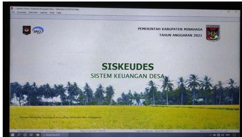
Gambar 2. Aplikasi Sistem Keuangan Desa

Adapun proses penggunaan Aplikasi Sistem Keuangan Desa (SISKEUDES) ini sangat mudah dan sederhana, yaitu sebagai berikut: