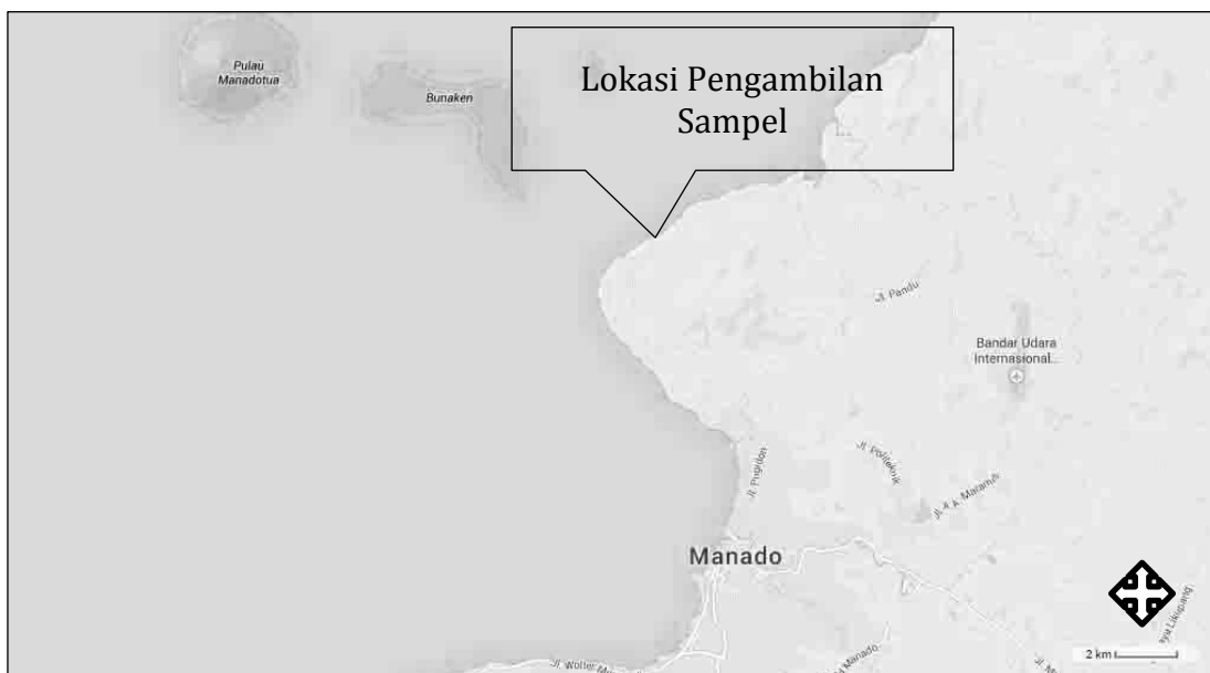
Gambar 1. Peta Lokasi Pengambilan Sampel.

Lokasi pengambilan terletak di perairan Molas, Kota Manado, Provinsi Sulawesi Utara (Gambar 1). Ekstraksi dan analisis sampel dilakukan di Laboratorium Toksikologi dan Farmasitika Laut Fakultas Perikanan dan Ilmu Kelautan UNSRAT.