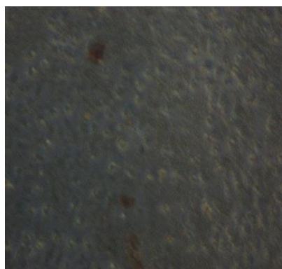
Gambar 3. Foto pengamatan sel kanker payudara T47D terhadap ekstrak daun sesewanua