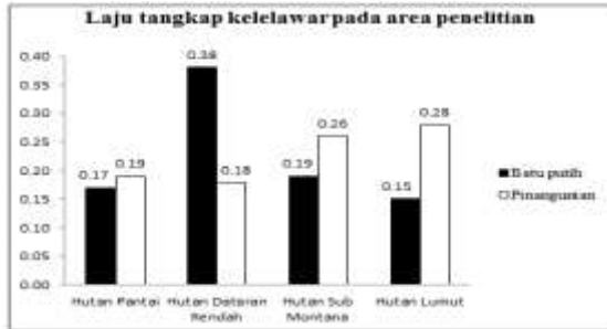
Gambar 3. Laju tangkapan spesies kelelawar di beberapa titik jalur lokasi Batu Putih dan jalur lokasi Pinangunian di Gunung Tangkoko.

Laju tangkapan spesies kelelawar dari beberapa titik jalur lokasi Batu Putih dan jalur lokasi Pinangunian di Gunung Tangkoko, nilai tertinggi terdapat pada hutan dataran rendah (0,38 ind/net/jam/hari) dan hutan lumut (0,28 ind/net/jam/hari), karena kondisi vegetasi pada hutan dataran rendah dan hutan lumut umumnya tertutup. Hutan dataran rendah dan hutan memiliki vegetasi yang tinggi dan rapat karena banyak pohon-pohon besar dan tinggi yang bermanfaat bagi spesies kelelawar untuk tempat berlindung dari predator, bereproduksi dan tempat mencari makan.