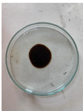
Gambar 4. Hasil Uji Kadar Air

Hasil kadar air yang didapat dari masing-masing sediaan terbukti memenuhi syarat yang ditetapkan oleh SNI. Jumlah kadar air setiap formulasi tidak jauh berbeda. Hal ini disebabkan oleh jumlah ekstrak kental dari sampel serta jumlah CMC dan SLS yang cenderung sama banyak (Dimpudus et al. , 2017).