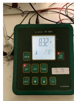
Gambar 2. Hasil Uji pH

Berdasarkan pengamatan yang dilakukan, semua formulasi sabun cair berada pada nilai pH 8,00 – 10,70. Nilai tersebut mengindikasikan bahwa sabun cair telah memenuhi syarat SNI dan aman bagi kulit. Nilai pH sabun cair bersifat basa. Hal ini dikarenakan oleh salah satu bahan dasar, yaitu KOH yang digunakan untuk menghasilkan reaksi saponifikasi dengan lemak atau minyak, atau dengan detergen sintetis yang memiliki nilai pH diatas pH netral (Wijana et al. , 2009).