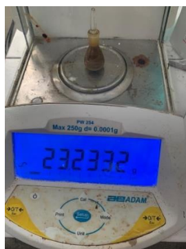
Gambar 6. Hasil Uji Bobot Jenis

Nilai bobot jenis dipengaruhi suatu bahan penyusunnya dan sifat fisiknya. Uji bobot jenis bertujuan untuk mengetahui kekentalan sabun cair (Dimpudus et al. , 2017). Berdasarkan SNI, syarat bobot jenis sabun cair, yaitu 1,01- 1,1 g/mL. berdasarkan hasil pengamatan, nilai bobot jenis dari setiap formulasi telah memenuhi syarat SNI. Dengan demikian, sabun cair pada penelitian ini diharapkan dapat mudah dibersihkan dengan air mengalir karena memiliki bobot jenis yang mendekati bobot jenis air (Sari dan Ferdinan, 2017).