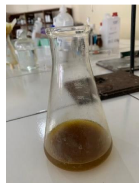
Gambar 5. Hasil Uji Alkali Bebas

Kadar alkali bebas menurut Standar Nasional Indonesia (SNI) harus maksimal 0,1%. Berdasarkan pengamatan yang dilakukan, kadar alkali bebas yang dihasilkan setiap konsentrasi memenuhi syarat (SNI) yaitu kurang dari 0,1%. Hal ini disebabkan karena pada saat pembuatan sabun cair dilakukan pemanasan yang cukup lama disertai dengan pengadukan sehingga sabun telah menjadi pasta dahulu sebelum ditambahkan bahan lainnya (Korompis et al. , 2020).