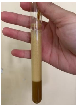
Gambar 3. Hasil Uji Tinggi Busa

Busa yang dihasilkan pada sabun cair berasal dari SLS yang merupakan bahan pembusa. Hasil pengamatan tinggi busa pada semua formulasi berada pada nilai 56-95. Hasil tersebut memenuhi syarat SNI yaitu antara nilai 13-220 mm. Nilai dari tinggi busa tidak jauh berbeda dikarenakan jumlah SLS dari setiap sediaan cenderung sama banyak.