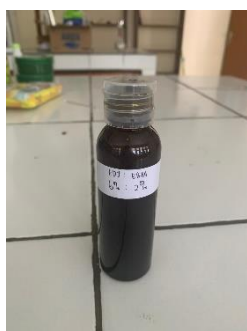
Gambar 1. Sediaan Sabun Cair

Bentuk sabun cair yang diinginkan yaitu cairan homogen. Bentuk dari sabun cair yang dihasilkan pada penelitian ini yaitu cair dan homogen yang berarti sudah memenuhi syarat SNI. Hal itu dikarenakan jumlah bahan dan proses pembuatan yang sudah sesuai. Bau yang dihasilkan yaitu bau yang khas. Bau ini berasal dari ekstrak tanaman serta pengaroma yang ditambahkan. Sedangkan warna sediaan sabun cair yang dihasilkan dipengaruhi oleh penambahan ekstrak. Sabun cair berwarna hijau pekat pada F1 dan F2 disebabkan karena adanya klorofil daun pada Jati. Sedangkan warna cokelat pada F3, F4 dan F5, menurut Dimpudus (2017), mengindikasikan adanya kandungan antosianin pada bunga Pacar air yang sudah bercampur dengan warna hijau dari daun Jati. Berdasarkan hasil yang diperoleh, pengamatan organoleptic ini sudah memenuhi standar yang ditetapkan oleh SNI.