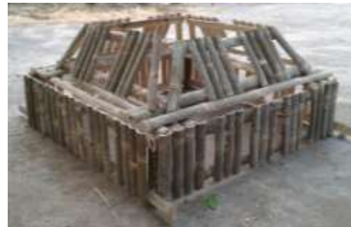
Gambar 1. Media bambu reef yang siap untuk diletakkan di perairan

bagian atas diletakkan satu unit berbentuk bidang trapesium.