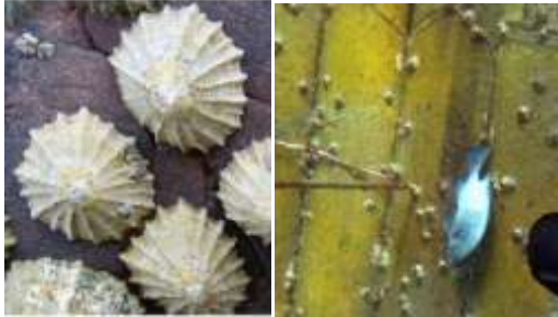
Gambar 4. Limpets Cellana ornata

jenis-jenis moluska yang hidup menempel pada substrat bambu seperti jenis limpets (Gambar 4), jenis-jenis algae , maupun ketertarikan ikan pada terumbu buatan tersebut, mengingat umur terumbu buatan tersebut masih berkisar 8 bulan.