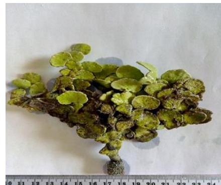
Gambar 2. Halimeda macroloba Decaisne

Thallus rimbun dan tegak. Segmen-segmen tebal dan berkapur sangat kaku berbentuk seperti gada. Mempunyai jumlah percabangan 3-4, tersusun tumpang tindih. Thallus berwarna hijau muda hingga hijau pada saat masih segar dan kuning kehijauan pada saat kering. Hidup pada substrat berpasir dan pasir bercampur lumpur (Gambar 2).