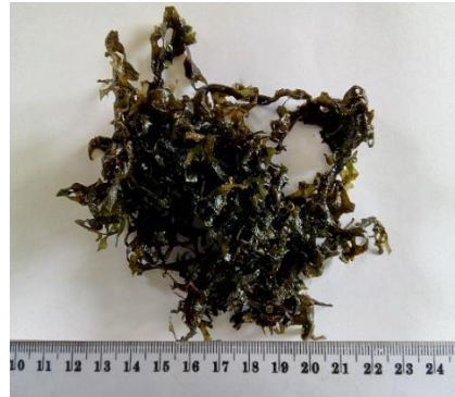
Gambar 5. Galaxaura apiculata Kjellman

Bentuk thallus rimbun, berwarna merah, percabangan dikotom dan tidak beraturan. Alat pelekat terletak dekat dengan batang. Hidup pada substrat batu karang di rataan terumbu dan di bebatuan (Gambar 5).