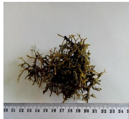
Gambar 6. Gracilaria edulis (S.G. Gmelin) P.C. Silva

Thallus berbentuk silindris, tinggi 6-10 cm. Bagian alat pelekat berbentuk cakram. Bercabang dikotom. Kadang dijumpai tidak beraturan. Pada bagian apeks biasanya mengecil dan melengkung waktu kering. Thallus berwarna coklat tua saat kering. Hidup pada substrat karang di rataan intertidal (Gambar 6).