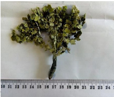
Gambar 3. Halimeda opuntia (Linnaeus) Lamouroux

Thallus tegak, bersegmen dengan percabangan trikotom. Segmen membentuk segitiga, segmen muncul pada segmen basal. Tinggi thallus 10 cm. Alat pelekat berupa filamen yang keluar dari segmen basal yang mencengkram substrat. Segmen-segmen berkapur, sangat kaku, bentuknya bertekuk tiga, susunannya tumpang tindih, tidak teratur dan tidak terletak pada satu percabangan tidak beraturan sehingga thallus terletak tidak pada satu bidang. Hidup pada substrat berpasir dan karang pada daerah intertidal hingga subtidal (Gambar 3).