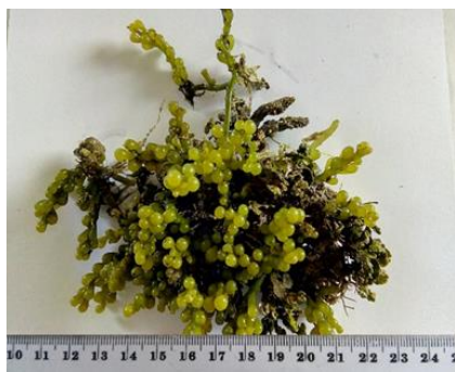
Gambar 1. Caulerpa racemosa (Forsskål) J. Agardh

Thallus menjalar secara horisontal dengan panjang stolon 10 cm dan diameter 0,3 mm. Terdapat cabang ramuli yang menyerupai buah berjumlah 2-5 yang berbentuk bulat bertangkai seperti buah anggur. Melekat dengan alat pelekat berjumlah 2-4. Ramuli tegak, bundar berbentuk bola-bola yang berlendir berwarna hijau muda agak kekuning-kuningan. Hidup pada substrat batu karang dan pasir berbatu di bagian atas subtidal (Gambar 1).