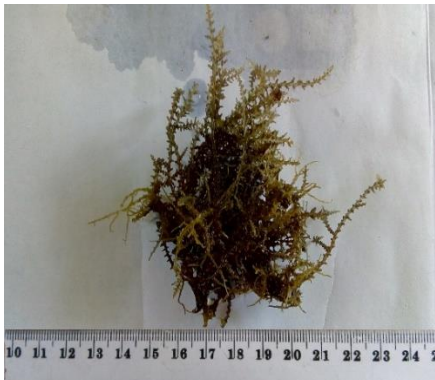
Gambar 8. Laurencia papillosa Yamada

Thallus berbentuk silindris, agak besar dengan tinggi 10-13 cm. Melekat dengan alat pelekat kecil. Pada bagian tengah thallus tertutup oleh ramuli yang berbentuk bulat dalam jumlah banyak. Bentuk percabangan tidak beraturan, cabang baru akan muncul dari batang, warna thallus cokelat. Hidup pada substrat berbatu, berpasir, pasir berlumpur di daerah intertidal (Gambar 8).