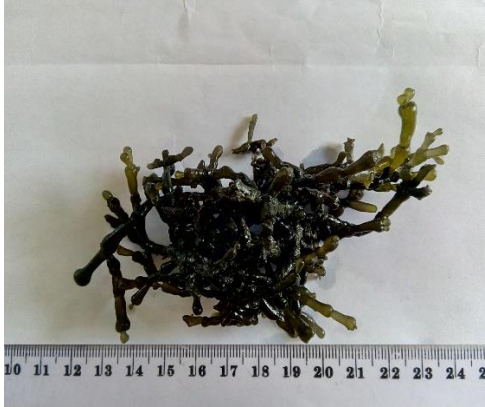
Gambar 7. Gracilaria salicornia (C. Agardh) Dawson

jernih. Pada perairan keruh berwarna cokelat tua. Hidup pada substrat karang, batu, berpasir di rataan intertidal (Gambar 7).