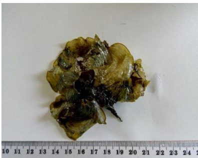
Gambar 4. Padina minor Yamada

Thallus relatif kecil dan tebal, bentuk daun seperti kipas, tinggi 4-7 cm, berwarna coklat kekuningan. Terdiri atas beberapa lembar cuping ( flabellate lobes ) dengan lebar 5-10 cm. Memiliki garis lengkung ganda ( concentric hair lines ) pada pangkal daun hingga memenuhi permukaan daun. Hidup pada substrat berpasir dan karang batu di daerah intertidal (Gambar 4).