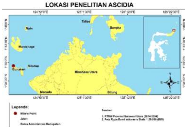
Gambar 1. Lokasi Pengambilan Data Ascidian