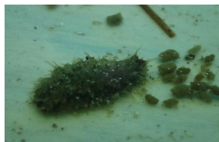
Gambar 2. Juvenil awal penelitian (a) dan Juvenil akhir penelitian (b)