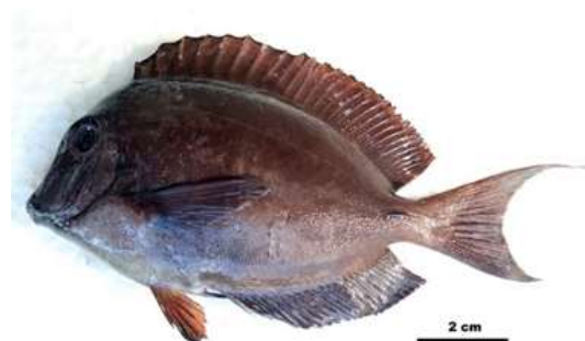
Gambar 2. Acanthurus nigrofuscus