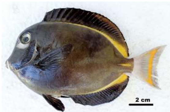
Gambar 5. Acanthurus nigricans