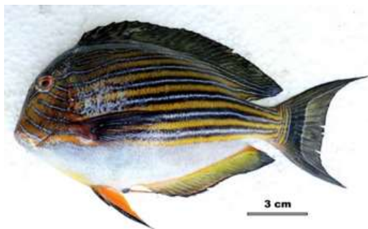
Gambar 3. Acanthurus lineatus

belakang hitam, sirip dada pucat kecuali pada dasarnya dimana mereka berwarna seperti tubuh, sirip perut kuning-oranye dengan tepi samping putih dan garis submarginal kehitaman.