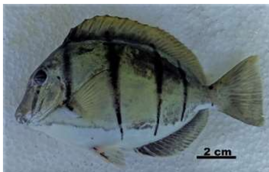
Gambar 4. Acanthurus triostegus

jari sirip anal 3, jari-jari sirip lunak anal 19-22. Tubuh berwarna abu-abu, dengan 4 garis vertical (1 garis di kepala melintasi mata kuning, 1 di pangkal ekor) putih di bagian perut, seringkali dengan garis batas pemisah yang tajam. Duri keras yang tajam, mengarah kedepan di setiap sisi pangkal ekor. Gigi dengan dentikulasi di bagaian samping dan atas. Tapis insang 18-22 dibaris anterior, 19-24 di baris posterior.