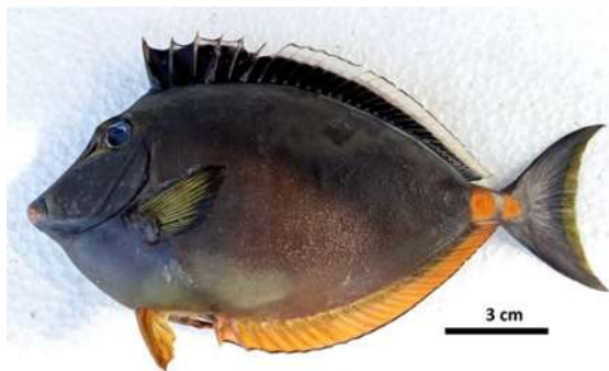
Gambar 7. Naso lituratus

biru keabu-abuan muda, ketika dalam masa spawning, jantan dengan cepat menampilkan zona putih kebiruan yang luas di tengkuk dan bagian anterior tubuh, diikuti oleh garis-garis sempit dengan warna yang sama yang memanjang ke sisi bawah.