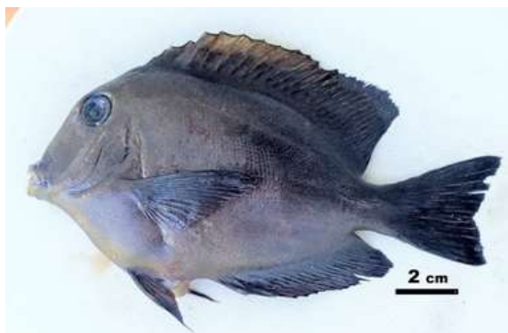
Gambar 6. Cetenochaetus cyanocheilus

sirip lunak 25-28, jari-jari keras sirip anal 3, jari-jari lunak sirip anal 22-26. Warna colat jingga sampai coklat tua dengan garis-garis kebiruan mengikuti barisan sisik, dada dengan gips kebiruan, kepala, tubuh bagian depan di atas dasar sirip dada dengan binti-bintik keuningan pucat yang sangat kecil, bibir biru, orbit sempit berbingkai uning kusam. Punggung dengan garis kebiruan memanjang dari tubuh. Kuning muda cerah tepi bibir dengan papillae halus. sirip ekor emarginate .