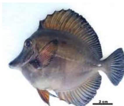
Gambar 10. Zebrasoma scopas