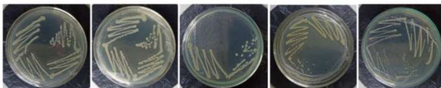
Gambar 3. Isolasi Bakteri dengan Metode Gores Kuadran

sederhana untuk menentukan proses degradasi polimer, yaitu dengan menghitung selisih antara berat awal dan berat akhir plastik setelah diinkubasi bersama bakteri, serta menggunakan kontrol untuk memastikan kehilangan berat plastik yang sebenarnya (Rohaeti, 2009).