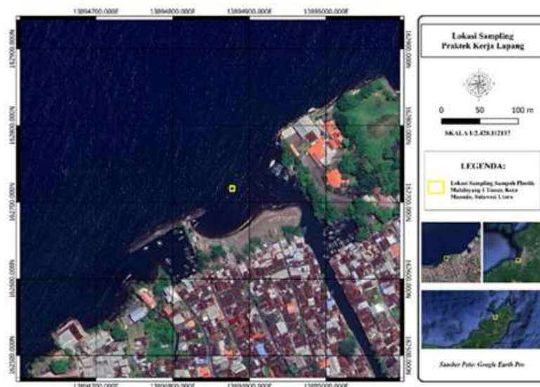
Gambar 1. Peta lokasi pengambilan sampel.

Sebanyak 200 \mu l hasil pengenceran ditempatkan di atas media NA menggunakan micropipet dan disebarkan menggunakan L-glass . Cawan petri dibungkus kembali menggunakan plastik wrap dan diinkubasi pada suhu 34°C selama 24-48 jam dengan posisi terbalik.