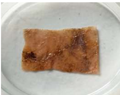
Gambar 1. Sampel Sampah Plastik

Sampel sampah plastik yang diambil dari Perairan Malalayang, berupa kantong plastik kresek seperti pada Gambar 2. Koloni tunggal bakteri dari sampah plastik berhasil tumbuh pada media NA setelah melalui pengenceran 10^{-2} (Gamber 3). Hasil pengenceran menunjukkan penurunan signifikan dalam pertumbuhan koloni bakteri pada media.