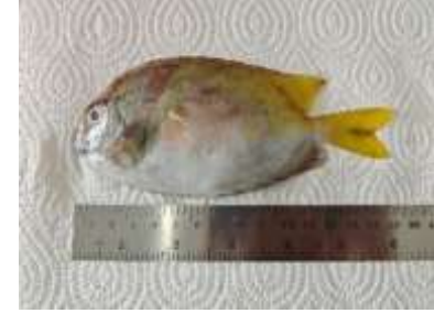
Gambar 8 Siganus doliatus