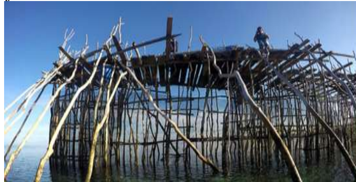
Gambar 2 Alat tangkap 'sero'

lamun untuk mengamati dan mendokumentasikan jenis ikan yang ditemukan di lokasi penelitian. Pengoperasian alat tangkap dilakukan mengikuti kondisi pasang surut perairan sehingga ikan yang masuk ke area padang lamun dapat tertangkap saat air mulai surut. Menurut Hutubessy et al. (2020), penggunaan alat tangkap tradisional seperti sero cukup efektif dalam pengambilan sampel ikan di perairan pesisir dangkal dan ekosistem lamun. Ikan hasil tangkapan kemudian dihitung jumlah individunya dan didokumentasikan untuk proses identifikasi lebih lanjut.