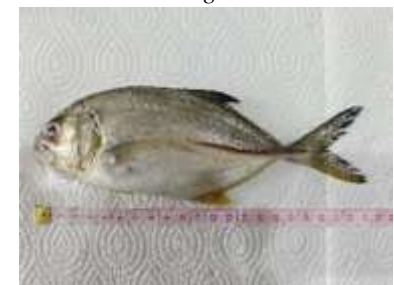
Gambar 10 Caranx sexfasciatus