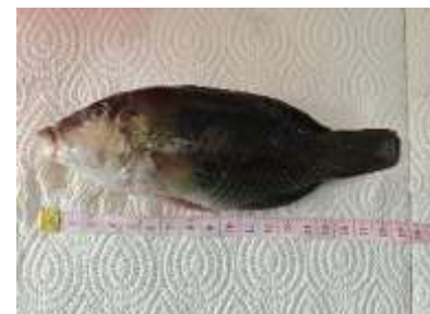
Gambar 12 Hemigymnus melapterus

Selain itu, penelitian Pratama et al. (2020) di Pantai Sindhu, Bali, melaporkan bahwa komunitas ikan padang lamun didominasi oleh ikan-ikan yang memanfaatkan lamun sebagai daerah pembesaran dan mencari makan. Penelitian tersebut menemukan 22 spesies ikan dari 11