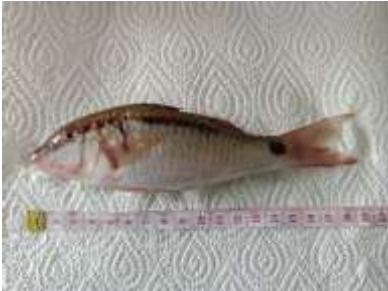
Gambar 5 Parupeneus barberinus