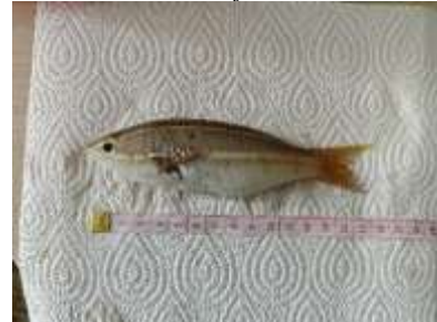
Gambar 6 Pentapodus bifasciatus