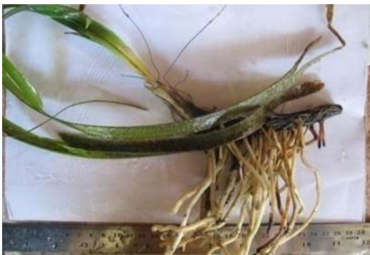
Gambar 13 Enthalus acoroides

Jenis lamun dominan yang ditemukan di Pantai Wawontulap yaitu Enhalus acoroides (Gambar 13) dan Thalassia hemprichii (Gambar 14) diduga berkontribusi besar terhadap keberadaan ikan pada lokasi penelitian. Kedua lamun ini memiliki morfologi daun yang lebar dan rimpang yang kuat sehingga mampu menyediakan tempat perlindungan bagi juvenil ikan serta berbagai organisme bentik yang menjadi sumber makanan ikan. Hal ini sesuai dengan pernyataan Ardhiani et al. (2020) bahwa padang lamun dengan tutupan yang baik umumnya memiliki hewan asosiasi yang lebih beragam karena menyediakan sumber energi, tempat pemijahan, dan daerah asuhan bagi biota laut.