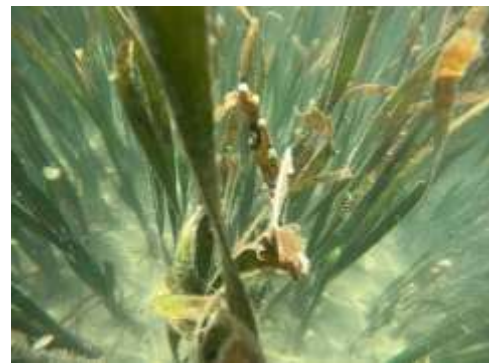
Gambar 14 Thalassia hemprichii .

Keberadaan ikan herbivora dari genus Siganus dan Scarus pada lokasi penelitian juga menunjukkan bahwa padang lamun di Pantai Wawontulap masih mendukung rantai makanan alami. Ikan-ikan herbivora berperan penting dalam menjaga produktivitas primer ekosistem dengan mengontrol pertumbuhan epifit dan makroalga pada daun lamun. Jika populasi herbivora menurun, maka pertumbuhan alga dapat meningkat dan mengganggu proses fotosintesis lamun. Kondisi ini menunjukkan pentingnya menjaga keseimbangan komunitas ikan untuk mempertahankan kesehatan ekosistem padang lamun.