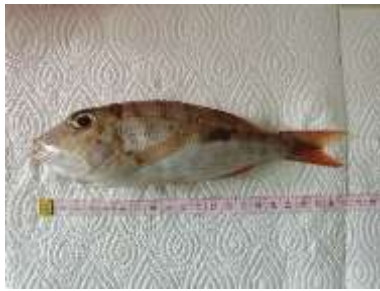
Gambar 3 Lethrinus semicinctus