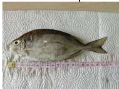
Gambar 9 Siganus fuscescens