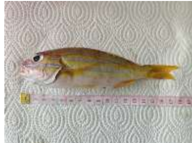
Gambar 4 Lutjanus kasmira