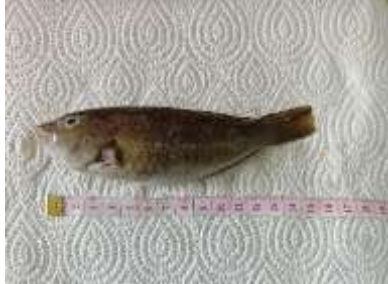
Gambar 7 Scarus psittacus