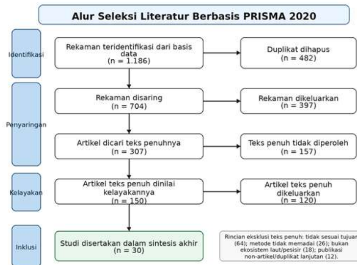
Gambar 1. Diagram alur seleksi literatur berdasarkan PRISMA 2020.

Ekosistem perairan terbuka, estuaria, dan studi multi-ekosistem relatif lebih sedikit, meskipun kelompok ekosistem tersebut penting untuk memahami konektivitas ekologis dan pengelolaan bentang laut secara terpadu.