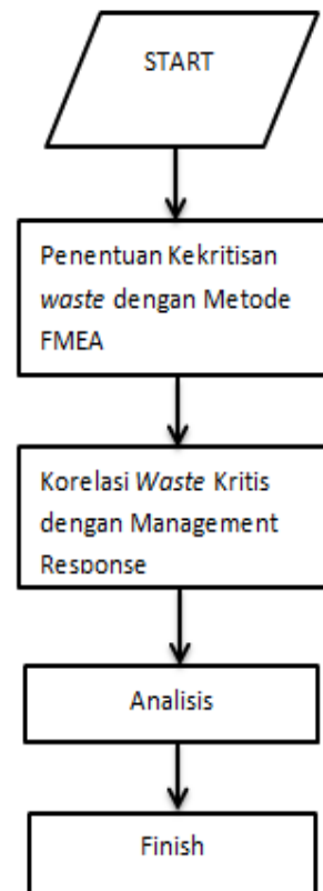
Gambar 3.2. Diagram Alir Integrasi FMEA dan QFD dalam Penelitian

Selanjutnya diagram alir yang menggambarkan penggunaan metode FMEA dan QFD dalam upaya menangani kejadian waste dalam kegiatan pemeliharaan dalam studi penelitian ini adalah sebagai berikut: