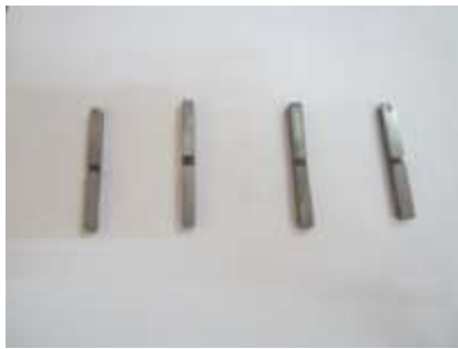
Gambar 4.3 Spesimen Uji Impak