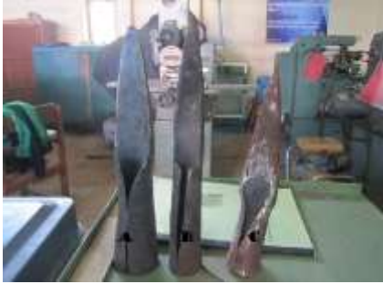
Gambar 4.1 Alat Pengupas Kelapa (Lewang)

(a). Parepei, (b). Tombasian, (c). Wuluan