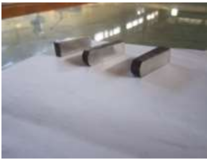
Gambar 4.2 Spesimen Uji Kekerasan

(a). Parepei, (b). Tombasian, (c). Wuluan