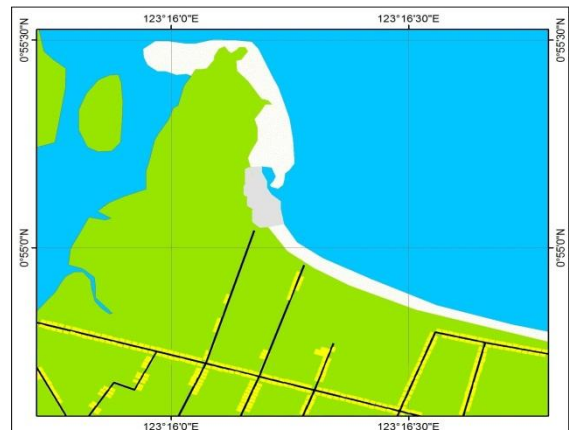
Gambar 2. Peta Situs Objek Wisata Pantai Batu Pinagut

Pantai Batu Pinagut terletak ± 3 Km dari Ibu kota Kabupaten Bolaang Mongondow Utara. Sedang jarak dari Manado sebagai ibu kota provinsi ± 300 Km, dapat juga dicapai dari Provinsi Gorontalo ±125Km.