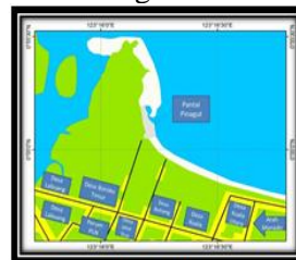
Letak Pantai Batu Pinagut

Accessibility atau aksesibilitas adalah sarana dan infrastruktur untuk menuju destinasi. Akses jalan raya, ketersediaan sarana transportasi dan rambu-rambu penunjuk jalan merupakan aspek penting bagi sebuah destinasi. Banyak sekali wilayah di Indonesia yang mempunyai keindahan alam dan budaya yang layak untuk dijual kepada wisatawan, tetapi tidak mempunyai aksesibilitas yang baik, sehingga ketika diperkenalkan dan dijual, tak banyak wisatawan yang tertarik untuk mengunjunginya. Posisi objek wisata pantai Batu Pinagut memiliki letak yang sangat strategis karena terletak di dalam kota dan sangat mudah untuk diakses baik menggunakan mobil, motor ataupun angkutan umum (bentor). Rambu-rambu penunjuk jalan juga sudah dibuat untuk menunjukkan destinasi objek wisata pantai Batu Pinagut.