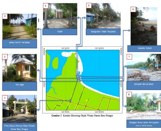
Gambar 2. Kondisi Eksisting Objek Wisata Pantai Batu Pinagut

Objek wisata pantai Batu Pinagut dikelola oleh Dinas Perhubungan Pariwisata komunikasi dan Informasi tanpa ada campur tangan stakeholder lain. Namun pihak pemerintah belum memungut kontribusi masuk kepada pengunjung yang datang, sehingga belum ada pemasukan dalam pengelolaan objek wisata Pantai Batu Pinagut baik segi keamanan, kebersihan dan penambahan fasilitas. Berbagai fasilitas seperti pintu gerbang, pos jaga, MCK dan gazebo telah dibangun oleh Pemerintah, akan tetapi dalam penggunaannya tidak dipergunakan maksimal karena berbagai hal seperti pos jaga yang seharusnya ditempati oleh petugas keamanan ataupun petugas pemungutan retribusi masuk tidak dipergunakan semestinya, toilet yang dibangun tidak terdapat air melainkan harus menimba di sumur bagian depan toilet, dari 12 gazebo yang telah dibangun hanya tersisa 6 yang masih berdiri hal ini dikarenakan abrasi pantai yang menggerus pasir sehingga mengikis tumpuan gazebo dan akhirnya roboh.