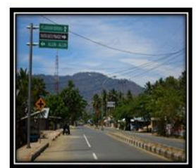
Rambu Penunjuk Jalan Objek Wisata