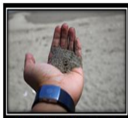
Pasir Putih Pantai Batu Pinagut