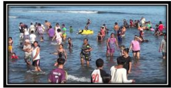
Tradisi Mandi Safar

Pantai Batu Pinagut sering diadakan upacara-upacara perayaan adat maupun keagamaan seperti mandi safar untuk menolak bala, tradisi ini hanya dilakukan pada hari minggu pada pekan kedua bulan safar tahun hijriah.