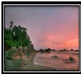
Keindahan Pantai Batu Pinagut

Pantai Batu Pinagut memiliki pasir yang putih dan halus, terdapat batu-batuan kapur yang terdapat di pantai Batu Pinagut juga menjadi daya tarik tersendiri bagi wisatawan.