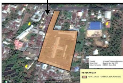
Gambar 2. Peta Lokasi Terminal Malalayang