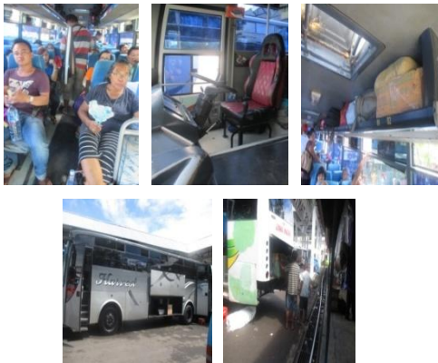
Gambar 3. Kondisi Fasilitas Angkutan Antar Kota Antar Propinsi Di Terminal Malalayang

Dari tabel diatas dapat diketahui secara pasti pelayanan jasa angkutan antar kota antar propinsi kepada penumpang. Sebanyak 60% responden yang memberikan jawaban baik terhadap pelayanan yang diberikan jasa angkutan antar kota antar propinsi kepada penumpang. Sebanyak 16% responden yang memberikan jawaban kurang baik terhadap pelayanan jasa angkutan kepada penumpang, sedangkan jawaban sangat baik memperoleh presentase sebanyak 24%. Maka dari hasil tabel diatas dapat disimpulkan bahwa kinerja pelayanan jasa angkutan antar kota antar propinsi kepada penumpang baik dan penumpang merasa nyaman. Berikut merupakan gambar kondisi angkutan antar kota antar propinsi di terminal Malalayang.