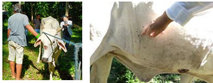
Gambar 4. Praktek pengenalan jenis serangga pengganggu ternak sapi.

Berdasarkan hasil diskusi, wawancara, observasi lapangan maka Tim kesehatan ternak Unsrat menyusun rencana edukasi masyarakat terkait pengenalan serangga pengganggu ternak yang ditemukan di Desa Batuputih, pengenalan habitat, kerugian yang ditimbulkan serta potensi penyakit yang dapat ditimbulkan. Selanjutnya Tim melakukan kegiatan praktek menunjukkan jenis-jenis serangga dan menjelaskan tentang kerugian yang ditimbulkan (Gambar 4).