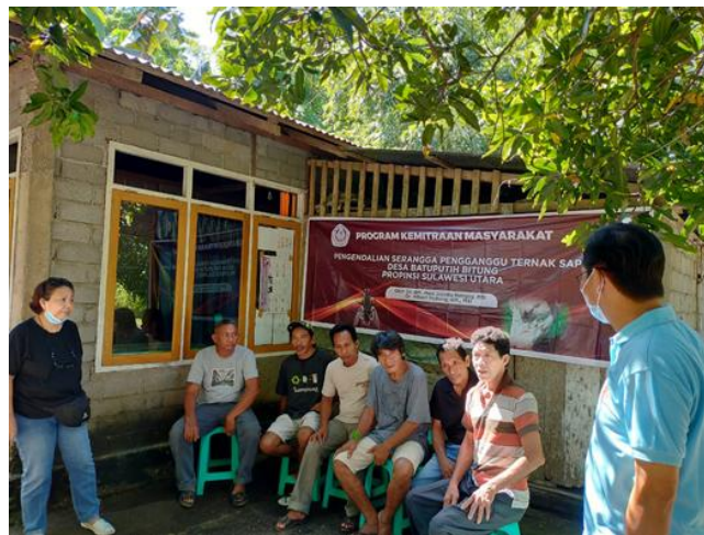
Gambar 1. Diskusi dan wawancara dengan peternak sapi.

bergejala kurus, tidak mau makan, jalan sempoyongan maka mereka akan memberikan ramuan tersebut. Menurut pengetahuan mereka sapi bergejala tersebut menderita sakit Surra. Peternak tidak mengetahui bahwa penyakit Surra berpotensi menular ke manusia melalui gigitan lalat. Kurangnya pengetahuan peternak, maka desa Batuputih dapat menjadi sumber penyebaran penyakit ternak maupun penyakit dari hewan ke manusia (Zoonosis) ke daerah lain. Tingkat pendidikan peternak desa Batuputih sangat terbatas (sebagian besar peternak menempuh pendidikan sampai tingkat SMP akan tetapi tidak tamat). Keterbatasan dalam tingkat pendidikan ini sangat berkorelasi dengan ketrampilan pengelolaan peternakan dan kesehatan ternak (Nangoy et al., 2018).