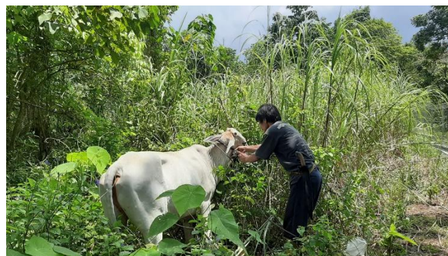
Gambar 3. Vegetasi lokasi pengembalaan.

Adapun hasil survey vegetasi di lahan pengembalaan (Gambar 3) untuk melakukan identifikasi habitat dari serangga ditemukan Saccharum spontaneum , Imperata cylindrical , cucurbitaceae , Verbenaceae , Asteraceae , Lantana sp.