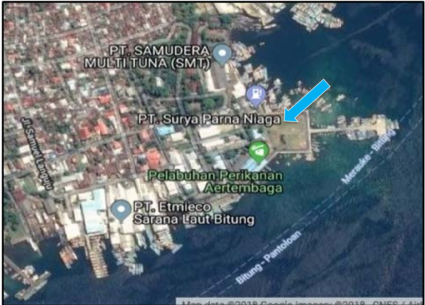
Gambar 2. Citra Satelit Pelabuhan Perikanan Samudera Bitung

Analisa yang telah dilaksanakan akan menghasilkan realisasi kinerja operasional dari Pelabuhan Perikanan Samudera Bitung dan penilaian berdasarkan standar yang digunakan. Selanjutnya dibuat tabel hasil analisa dan perbandingan sesuai parameter untuk memudahkan memberi kesimpulan dalam penelitian.