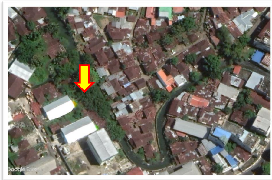
Gambar 1. Lokasi Penelitian