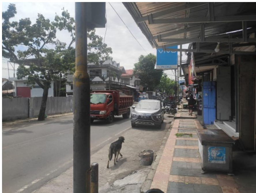
Gambar 5. Situasi Titik 2