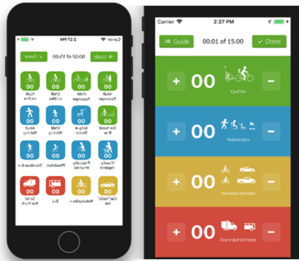
Gambar 1. Aplikasi Traffic Counter