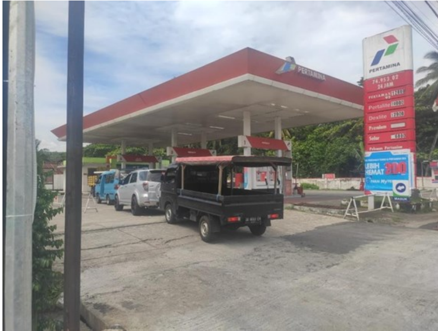
Gambar 4. Situasi Titik 1