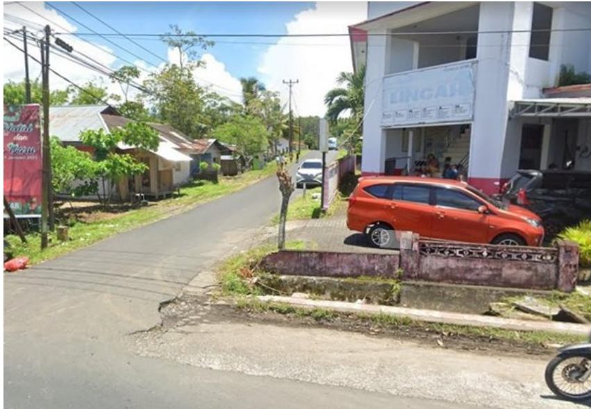
Gambar 6. Situasi Titik 3