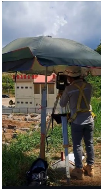
Gambar 6. Survey Penentuan Titik Bored Pile

Tim surveyor mengukur dan menentukan posisi titik koordinat pondasi bore pile dengan menggunakan alat theodolite atau waterpass. Setelah titik bor telah ditentukan, diberi tanda atau patok pada lokasi rencana bore pile. Untuk mempermudah pengecekan titik as koordinat bore pile, 2 titik bersudut 90 derajat akan di pasang di sekitar lokasi.