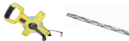
Gambar 4. 4 Roll Meter dan Rambu Ukur