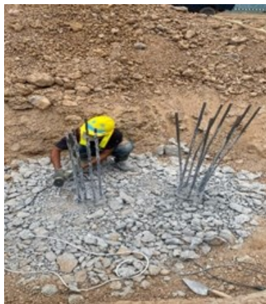
Gambar 10. Pengecoran