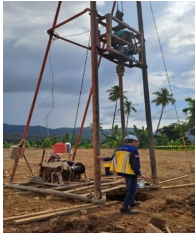
Gambar 7. Pengeboran

Sistem pengeboran yang dipakai pada proyek ini adalah menggunakan system bor putar (roartary drilling).Pengeboran ini menggunakan alat mini crane,metode yang satu ini dinilai efektif karena penggunaan bore pile ini tidak menghasilkan getaran.