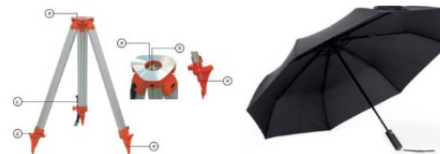
Gambar 4. 6 Statif dan Payung