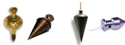
Gambar 4. 5 Unting-unting