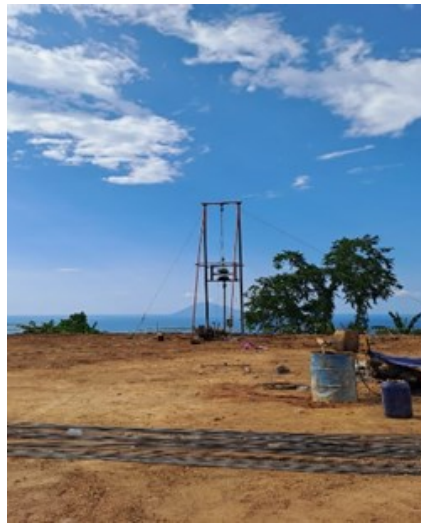
Gambar 9. Besi D16 yang akan Dipabrikasi