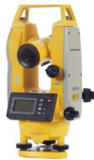
Gambar 4. 2 Theodolit

Theodolit merupakan alat ukur digital yang berfungsi melakukan pengukuran kontur tanah pada wilayah tertentu. Alat ini memiliki beberapa kelebihan diantaranya dapat digunakan untuk memetakan suatu wilayah dengan cepat. Hasil dari pengukuran wilayah menggunakan theodolit salah satunya adalah peta situasi dan peta kontur tanah. Untuk menggunakan alat theodolit diperlukan beberapa alat bantu, yaitu statif (kaki tiga), rambu ukur, unting-unting, rol meter, patok, payung, dan kompas.