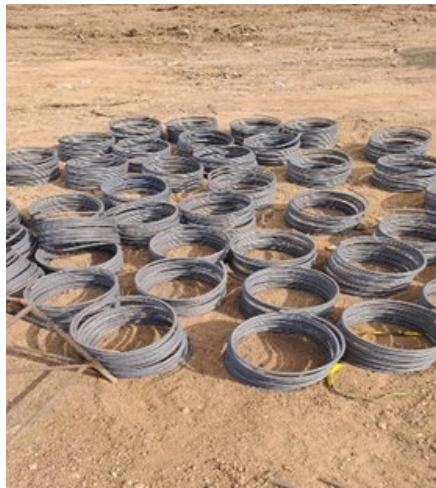
Gambar 8. Besi D10 yang akan Dipabrikasi