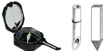
Gambar 4. 3 Kompas dan Patok