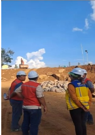
Gambar 5. Persiapan Lokasi Proyek