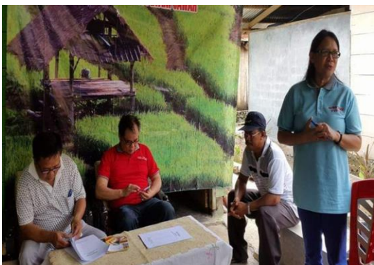
Gambar 3. Penyuluhan PKM

Hasil yang telah dilaksanakan dalam kegiatan Iptek Bagi Masyarakat (IbM) pada Kelompok Tani Desa Wineru dan Tim Iptek dari Program Studi Proteksi Tanaman Fakultas Pertanian Unsrat, dilakukan dalam bentuk penyuluhan melalui dua cara yaitu Tim Iptek menyampaikan materi kemudian ditindaklanjuti dalam bentuk diskusi atau Tanya jawab. Kegiatan transfer teknologi diharapkan para kelompok tani mendapatkan informasi yang benar sehingga timbul kesadaran dan menerima teknologi tersebut dan akhirnya dapat melakukannya atau mempraktekannya dalam upaya peningkatan produksi padi sawah yang ramah lingkungan (Gambar 3 dan 4).