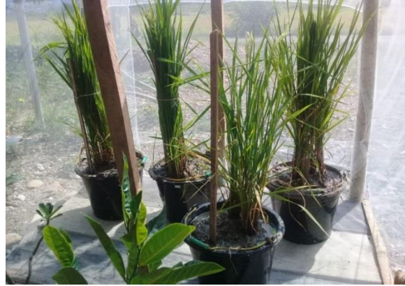
Gambar 5. Persiapan Demonstrasi Gambar 6. Aplikasi Cendawan Beauveria Pada Padi