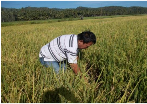
Gambar 1. Pencarian Patogen