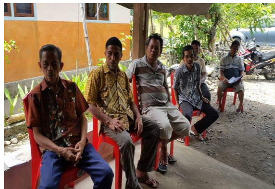
Gambar 4. Petani Padi Sawah