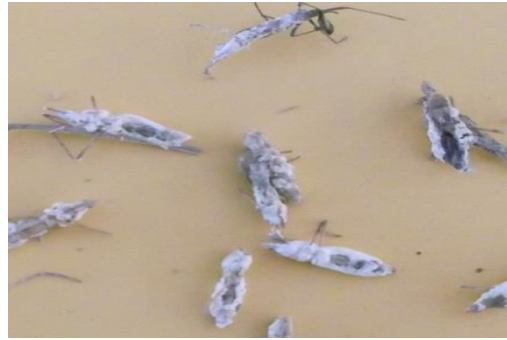
Gambar 2. Serangga yang terinfeksi dari lapang