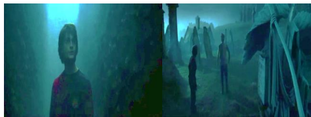
Adegan 5 (01:54:47)