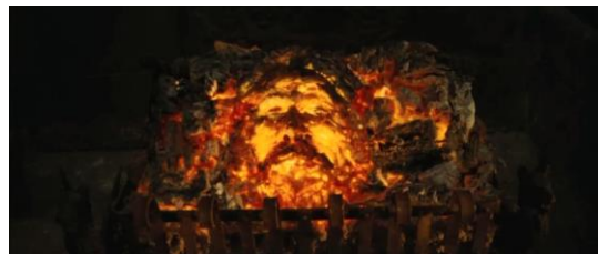
Adegan 2 (00:43:20)