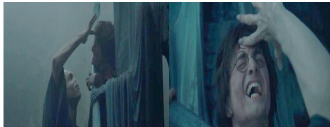
Adegan 7 (02:06:17 - 02:06:23)

Motif aksi dalam film ini, disebabkan oleh masalah orang tua yang diwariskan kepada keturunan mereka, sehingga Voldemort terus mencari cara untuk membunuh Harry . Mereka harus menyelesaikan masalah dimana orang tua biasanya adalah korban penjahat yang ingin membalas dendam. Adegan ketujuh pada menit ke 02:06:17 dan 02:06:23 nampak jelas bahwa Harry berada di tempat lain, yaitu tempat dimana yang menjadi mimpi Harry sebelumnya. Terlihat tempat itu berlatarkan kuburan. Dan merupakan tempat jebakan untuk Harry . Situasi yang tegang dan terasa mistis itu mengharuskan Harry dan Voldemort harus terlibat pertarungan. Sebelum terjadinya pertarungan, pada kedua gambar itu Voldemort mematahkan mitos sihir tua yang dipercaya selama tiga belas tahun, yaitu dengan menyentuh luka yang ada di kepala Harry tepatnya di atas dahi sebelah kanan. Ketika Voldemort menyentuh luka tersebut, terlihat Harry berteriak kesakitan.