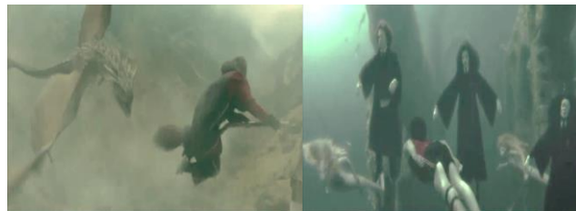
Adegan 3 (01:00:16)

dengan naga itu adalah sangat sulit karena naga yang dipilih olehnya yang paling berbahaya, sehingga sangat menguras energi untuk menghadapinya. Kemudian tantangan berlanjut, pada adegan keempat menit ke 01:34:36 Harry harus menyelamatkan teman-temannya dari makhluk laut yang jahat, Grindylow. Selanjutnya tiba pada tantangan terakhir dalam adegan kelima 01:54:47 Harry harus melewati labirin yang gelap untuk mendapatkan piala Triwizard sehingga bisa keluar sebagai pemenang turnamen. Adegan keenam pada menit ke 01:59:69 Harry harus diperhadapkan dengan jebakan yang di buat. Dalam gambar itu terlihat Harry dan Cedric telah lebih dulu keluar sebagai pemenang. Namun ketika menyentuh piala itu, mereka terjebak di tempat yang baru pertama kali di kunjungi. Cedric menyadari bahwa piala tersebut adalah sebuah portkey.