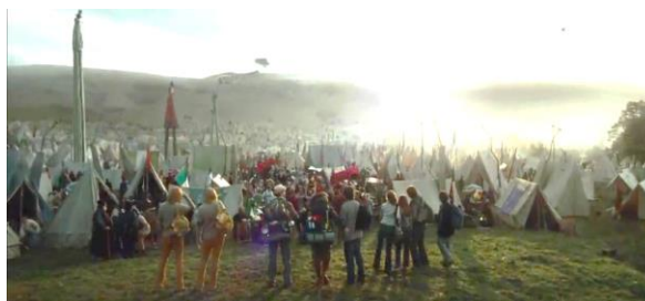
Adegan 1 (00:06:18)