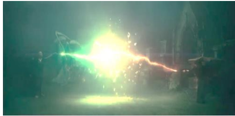
Adegan 8 (02:08:26)