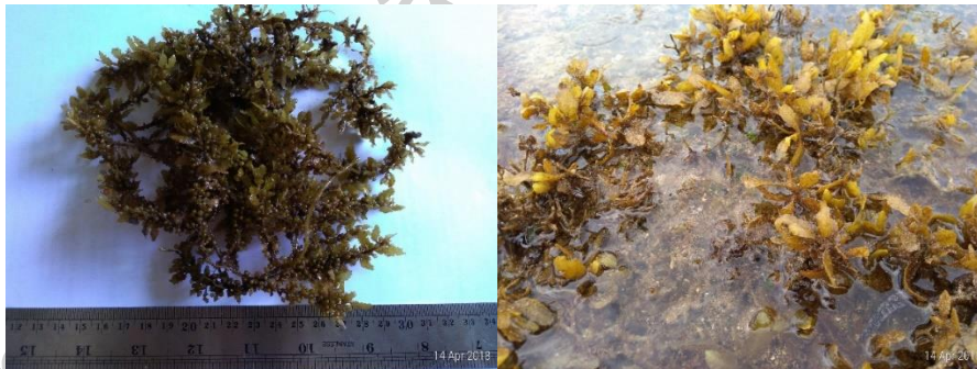
Gambar 11. Sargassum polycystum C.A. Agardh (herbarium dan di alam)

tinggi total 10 cm; percabangan rimbun seperti pohon; bentuk daun lonjong berwarna cokelat kehitaman memiliki pneumatokis 10 buah; thallus berwarna cokelat tua; hidup pada substrat berbatu di daerah rata-rata terumbu (Gambar 11).