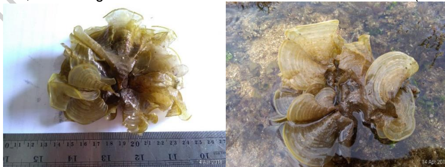
Gambar 9. Padina australis Hauck (herbarium dan di alam)

ganda pada permukaan bawah dimana mempunyai jarak sama satu dengan yang lain berkisar 2-3 mm. Pengapuran terjadi di bagian permukaan daun; hidup pada substrat berpasir, karang mati di daerah intertidal (Gambar 9).