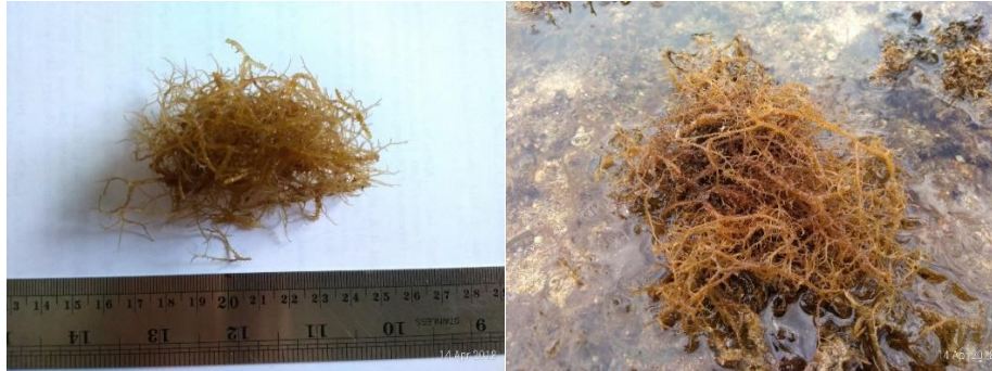
Gambar 15. Hypnea valentiae (Turner) Montagne (herbarium dan di alam)

batang 4,0 cm dan lebar 0,1 cm; memiliki cabang-cabang (duri) pendek di sekitar thallus yang dalam bentuk herbarium kelihatan seperti rambut-rambut halus; hidup pada substrat berpasir (Gambar 15).