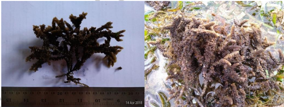
Gambar 16. Laurencia papillosa (C. Agardh) Greville (herbarium dan di alam)

berbentuk bulat dalam jumlah banyak, bentuk percabangan tidak beraturan, cabang baru akan muncul dari batang, warna thallus cokelat; hidup pada substrat berbatu, berpasir, pasir berlumpur pada daerah intertidal (Gambar 16).