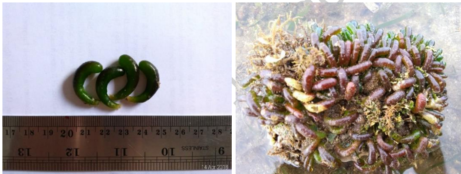
Gambar 8. Bornetella oligospora Solms-Laubach (herbarium dan di alam)

Thallus silindris dan berbentuk seperti jari, melengkung, bagian bawah thallus berwarna hijau dan coklat kemerahan pada bagian atas; tinggi thallus 1,5-2,0 cm dan lebar 0,3-0,4 cm; hidup membentuk koloni di daerah berbatu pada daerah intertidal (Gambar 8).