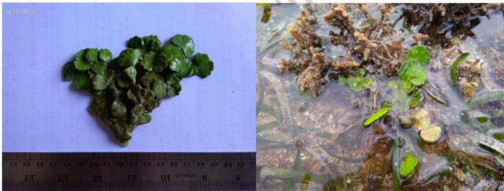
Gambar 6. Halimeda macroloba Decaisne (herbarium dan di alam)

Thallus rimbun dan tegak; segmen-segmen tebal dan berkapur berbentuk seperti gada; mempunyai jumlah percabangan 3-4, tersusun tumpang tindih; thallus berwarna hijau pada saat masih segar dan kuning kehijauan pada saat kering; hidup pada substrat berpasir dan pasir bercampur lumpur (Gambar 6).