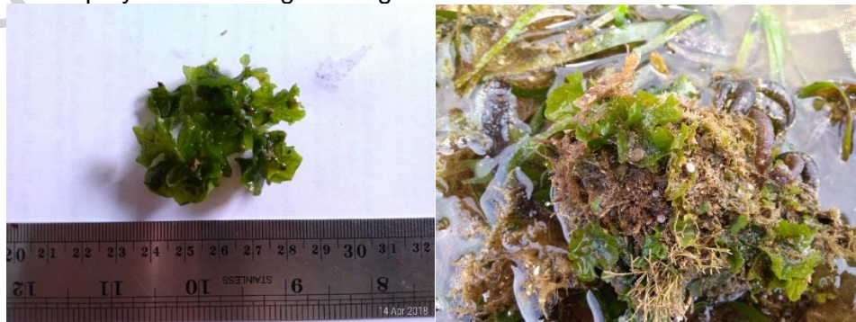
Gambar 2. Anadyomene wrightii Harvey ex J.E. Gray (herbarium dan di alam)

bergelombang; membentuk rumpun daun dimana semua batang daunnya menyatu dengan alat pelekat; hidup pada substrat karang mati; melekatkan diri dengan alat pelekat pada substrat keras di daerah intertidal (Gambar 2).