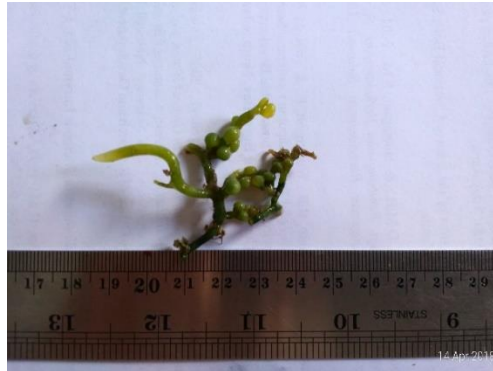
Gambar 5. Caulerpa racemosa (Forsskål) J. Agardh (herbarium)

Penelitian beberapa aspek dari populasi alga hijau C. racemosa telah dilakukan oleh Kepel dkk (2000), Kepel dan Rintjap (2002), Kase dkk (2002), Mantiri dkk (2003), Kepel dkk (2003), dan Mantiri dkk (2004).