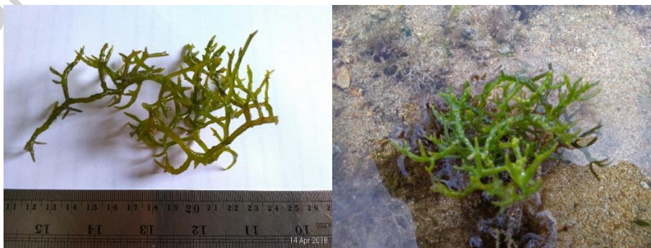
Gambar 14. Gracilaria arcuata Zanardini (herbarium dan di alam)

dan tebal tingginya mencapai 10 cm, berwarna hijau kecokelatan; hidup pada substrat berpasir pada daerah intertidal (Gambar 14).