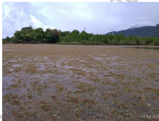
Gambar 1. Hamparan alga di lokasi penelitian

Penelitian ini berlangsung dari bulan April-Mei 2018. Tempat pelaksanaan penelitian yaitu di perairan pesisir Tongkaina, Kota Manado, Provinsi Sulawesi Utara dengan hamparan makroalga di wilayah pesisir (Gambar 1).