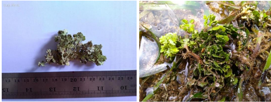
Gambar 7. Halimeda opuntia (Linnaeus) Lamouroux (herbarium dan di alam)

Penelitian beberapa aspek dari populasi alga hijau H. opuntia telah dilakukan oleh Saromeng dkk (2004), dan Parera dkk (2015).