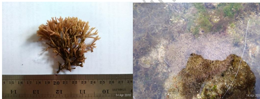
Gambar 13. Galaxaura oblongata (Ellis and Solander) Lamouroux (herbarium)

diukur dari alat pelekat sampai ke apeks 6-9 cm, sedangkan thallus yang diukur dari alat pelekat sampai ke percabangan pertama 0,5-1,0 cm, memiliki percabangan dikotom dan multiaksial, pada bagian cabang bundar dan lebar daun adalah 0,2 cm; pada saat masih segar spesies ini kemerah-merahan; hidup pada batu di daerah rata-rata terumbu (Gambar 13).