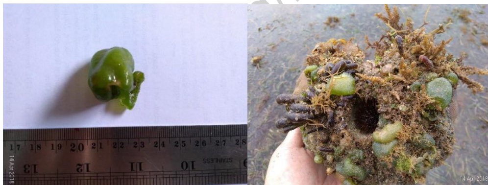
Gambar 4. Dictyosphaeria versluysii Weber-van Bosse (herbarium dan di alam)

kerak; memiliki alat pelekak diskoid yang terletak dekat thallus basal; hidup pada substrat berbatu di daerah subtidal (Gambar 4).