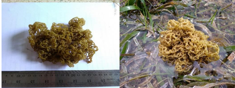
Gambar 10. Hydroclathrus clathratus (C. Agardh) Howe (herbarium dan di alam)